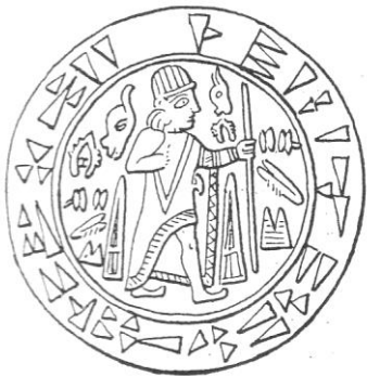
[fig. 5] Sceau dit de Tarkondemos

En 1900, L. Messerschmidt regroupe dans son livre intitulé Corpus Inscriptionum Hittiticarum le corpus de la centaine d'inscriptions hiéroglyphiques connues à l'époque à la fois en Anatolie et en Syrie. Mais le sens des signes reste largement opaque.