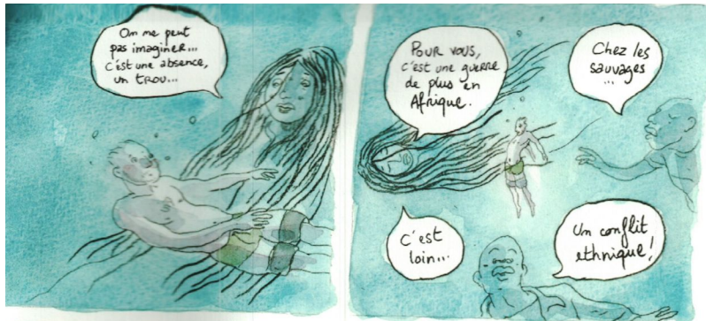
Figure 4 : Hippolyte et Patrick de Saint-Exupéry, La Fantaisie des dieux , p. 33

cauchemar, des images et des bribes de récit entendues l'assaillent 30 . Quand le récit laisse place à la