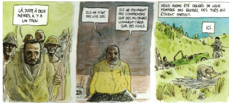
Figure 5 : Hippolyte et Patrick de Saint-Exupéry, La Fantaisie des dieux , p. 53