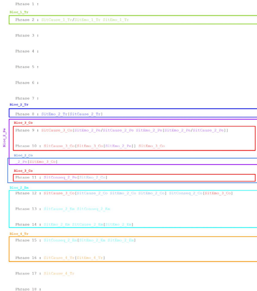
Figure 3 – Étape 2: résultat de la transformation formelle des annotations du texte 1 et segmentation en boîtes

57 En nous appuyant sur les indices j et k des étiquettes de chaque phrase, nous pouvons regrouper entre elles des phrases contiguës. Nous déduisons alors à cette étape huit blocs textuels, représentés par des boîtes colorées sur la figure 3. Un code couleur permet à la fois de différencier les blocs repérés et de mettre en évidence les étiquettes ayant servi de support à leur délimitation. Chaque couleur symbolise une des sept émotions exprimées dans le texte. Les blocs de la figure 3 correspondent aux regroupements suivants :