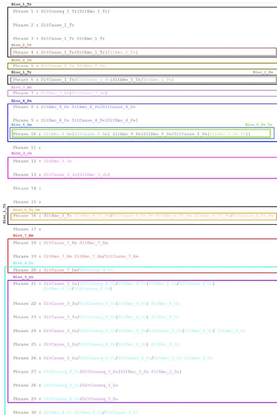
Figure 5 – Étape 2: résultat de la transformation formelle des annotations du texte 2 et segmentation en boîtes