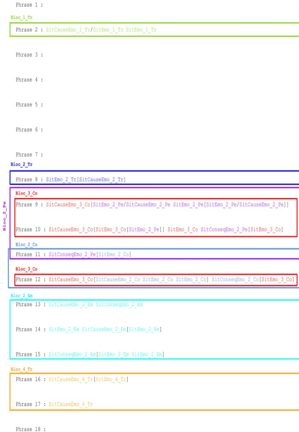
Figure 3 : Etape 2 : résultat de la transformation formelle des annotations du texte 1 et segmentation en boîtes