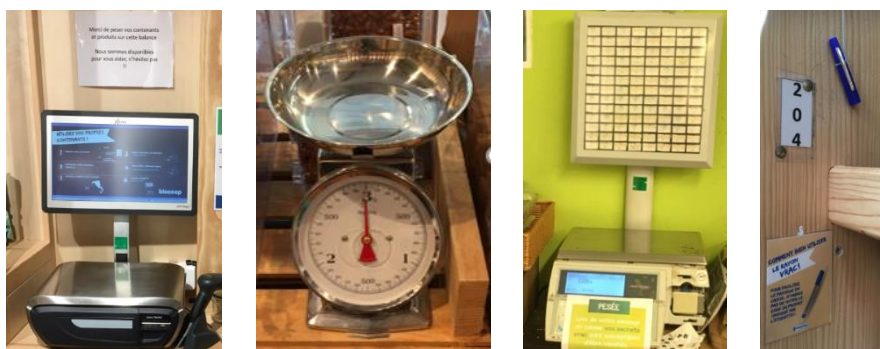
Tableau 2 : Synthèse des spécificités des pratiques liées du mix produits/services