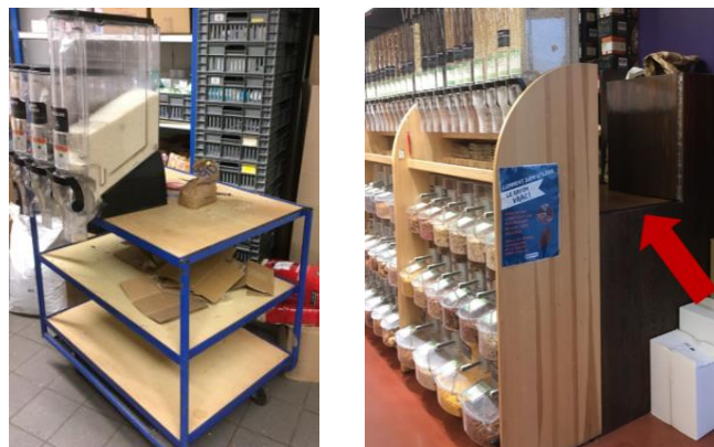
Figure 4 : Dispositifs matériels facilitant le travail de mise en rayon

Si, pour la distribution des produits emballés, la mise en rayon se fait majoritairement avant l'arrivée des clients en magasin, en vrac elle se fait en continu car les dispositifs peuvent se vider rapidement, au fil de la journée. Les produits doivent par ailleurs être manipulés avec une grande précaution afin d'éviter d'en perdre (i.e., produits friables). Ainsi, les compétences des responsables du rayon vrac évoluent vers l'entretien et le nettoyage afin d'assurer une bonne