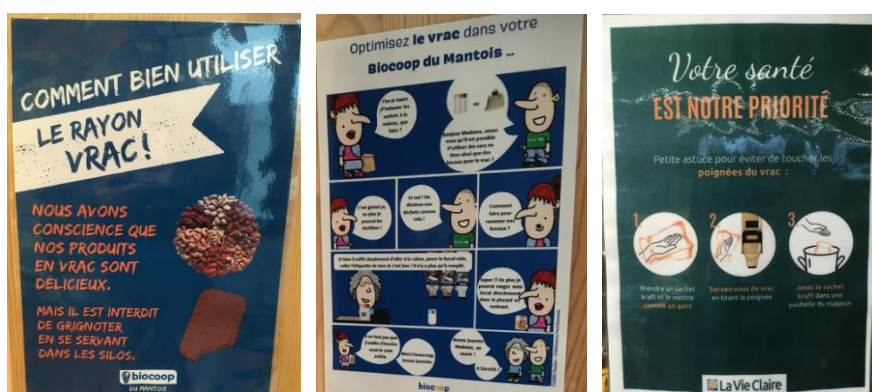
Figure 7 : Affichage en magasins donnant à voir les significations du vrac

Pour éviter une surabondance d'informations sur le lieu de vente, les magasins spécialisés en vrac s'appuient sur le digital, et notamment les réseaux sociaux, pour communiquer, par exemple, sur de nouveaux produits, de nouveaux fournisseurs ou pour rassurer les clients sur les procédures d'hygiène. « On essaie de montrer aux clients qu'on est sérieux, on fait des posts sur Instagram pour montrer le processus de nettoyage, parce qu'ils ne le voient pas [...] j'ai pris en photo mon diplôme pour montrer que c'est carré, qu'on ne fait pas ça juste comme ça. » (responsable de magasin proposant du vrac). Ceci implique donc, pour les distributeurs, d'être compétents dans ce domaine, afin de créer une communication efficace sur ces canaux.