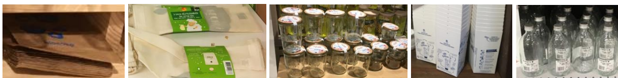
Figure 1 : Variété des contenants proposés aux clients (sachets, bocaux, boîtes, bouteilles)

considéré comme un service supplémentaire fourni par les magasins. « Pour les consommateurs, ce n'est pas pratique, il faut gérer les bocaux, ça demande de l'anticipation, de l'organisation (...) pour faciliter l'achat en vrac, il faut toujours avoir des contenants à proposer aux clients quand même. Il faut inciter les gens à venir plutôt avec des sacs en tissu que des bocaux pour le vrac et leur dire qu'ils pourront transvaser ensuite dans leur bocal chez eux, c'est plus léger » (responsable de magasin proposant du vrac).