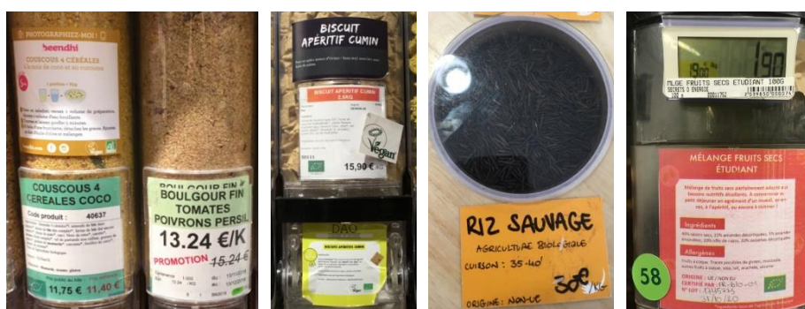
Figure 6 : Etiquettes apposées sur le mobilier pour délivrer l'information au consommateur

En vrac, les produits étant vendus « nus », la fourniture d'informations doit passer par d'autres supports que l'emballage. Présente pour la distribution des produits emballés essentiellement pour communiquer le prix, l'étiquette prend une tout autre dimension en vrac. Apposée sur les silos et bacs, elle est un objet matériel de première importance puisqu'elle devient l'un des rares supports d'information sur les produits (Figure 6). Elle indique ainsi les informations réglementaires (composition, provenance et prix du produit, par exemple) mais aussi d'autres, comme une recette ou un temps de cuisson. Chez certains distributeurs, ces étiquettes sont standardisées et informatisées tandis que chez d'autres elles sont davantage « bricolées », écrites à la main, et ne comportent pas toujours les mêmes informations d'un produit à l'autre : « c'est un peu du patchwork on a l'impression que c'est pensé, mais pas vraiment à l'avance, on a quelque chose et, ensuite, autre chose vient se greffer (...) chez [distributeur concurrent] tout est géré par le siège, donc c'est la même étiquette pour tous les [nom du distributeur] de France (...) ici c'est moi qui recopie l'étiquette qu'il y a sur le carton » (responsable de rayon vrac).