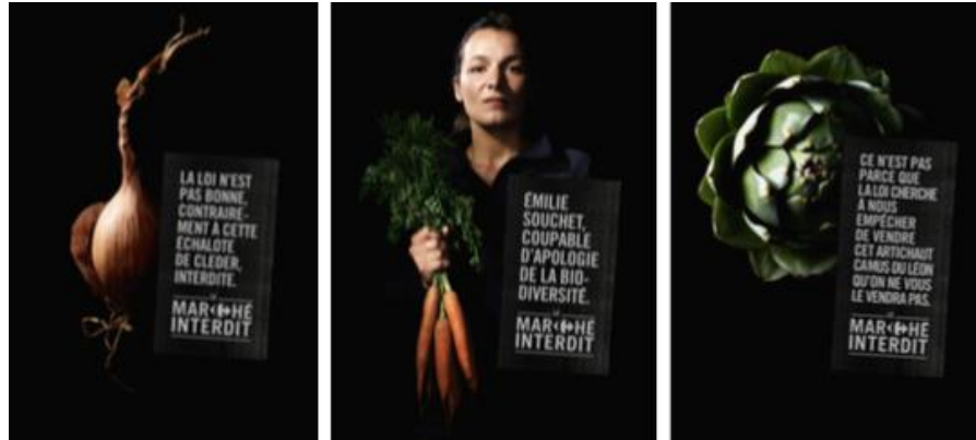
Figure 1 : Visuels de la campagne publicitaire de Carrefour

La législation interdit aujourd'hui le commerce de semences de plus de 2 millions de variétés issues de notre patrimoine et prive ainsi le grand public d'une diversité de choix dans son alimentation. Carrefour rejoint le combat des producteurs pour rendre accessible aux consommateurs des fruits et légumes issus de semences paysannes et interpelle les pouvoirs publics pour faire changer la Loi qui interdit leur commercialisation car elles ne sont pas inscrites au catalogue officiel des semences autorisées. Cette démarche s'inscrit dans la continuité des engagements historiques de l'enseigne en faveur de la qualité alimentaire et de la biodiversité. À partir du 20 septembre, Carrefour propose à la vente une offre de fruits et légumes issus de semences paysannes dans une quarantaine de magasins franciliens et bretons jusqu'alors jamais commercialisés en grande surface. Une dizaine d'espèces de fruits et légumes issus de l'agriculture biologique est disponible. La liste des produits issus des semences paysannes évoluera au fil des saisons.