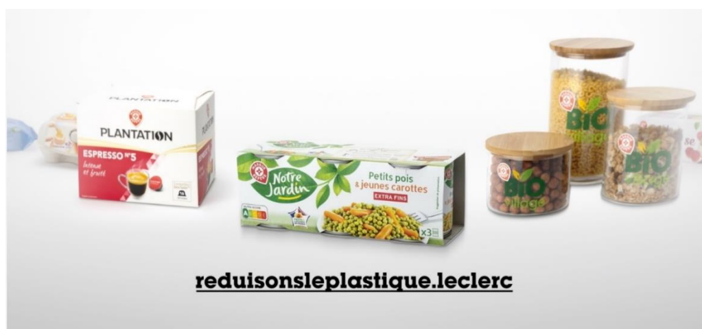
Figure 2 : Visuels de la campagne publicitaire de Leclerc

Marque Repère supprime progressivement le plastique superflu de ses produits. Ça n'a l'air de rien, mais ça fait des tonnes de plastique en moins. Pour Marque Repère, réduire l'impact plastique de nos produits est un véritable combat au quotidien.