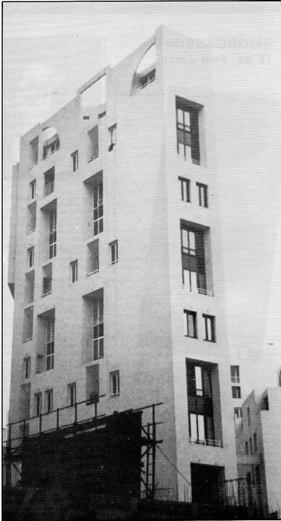
les Hautes Formes

qualité de la modénature qui rendait quelquefois merveilleuse la lumière à l'intérieur. On ne peut plus traiter de la même manière, on ne peut plus raisonner de la même façon et penser des plans masses comme ça : retour à la rue, retour à l'îlot, tel, quel, littéral, me semblent et m'ont toujours semblé des solutions vouées à faire des prisons un peu claustrophobes. Parce qu'on construit avec d'autres façons et on est amené à trouver d'autres qualités à ces espaces. La densité que l'on est amené à faire en ville, il faut lui trouver d'autres choses; aux Hautes Formes c'est assez présent : ces échappées lumineuses, ces trouées, ce qui fait que justement ce n'est pas une rue avec des bâtiments en bandes des deux côtés. Ce n'est pas une place ou une cour fermée ou ouverte d'un seul côté.