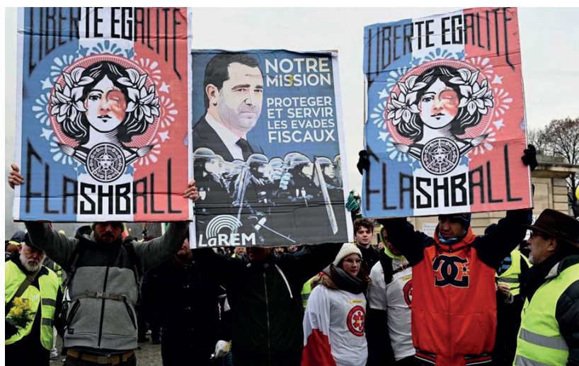
L'œuvre de Shepard Fairey a été détournée. La devise française « Liberté, Égalité, Fraternité » est devenue « Liberté, Égalité, FlashBall ».