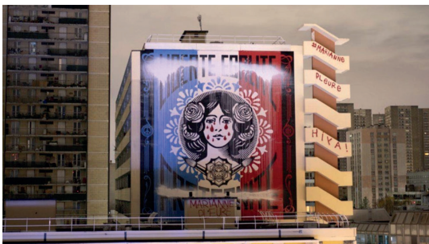
La fresque Liberté, Égalité, Fraternité d'Obey après une action des vandales à Paris, dans la nuit du 13 au 14 décembre.