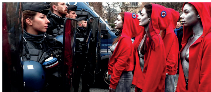
Femen s'alignant nez-à-nez avec un cordon de CRS ? Tous droits réservés