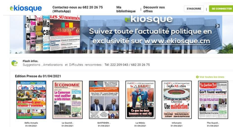
Figure 1 : Le site internet de la plateforme camerounaise e-kiosque