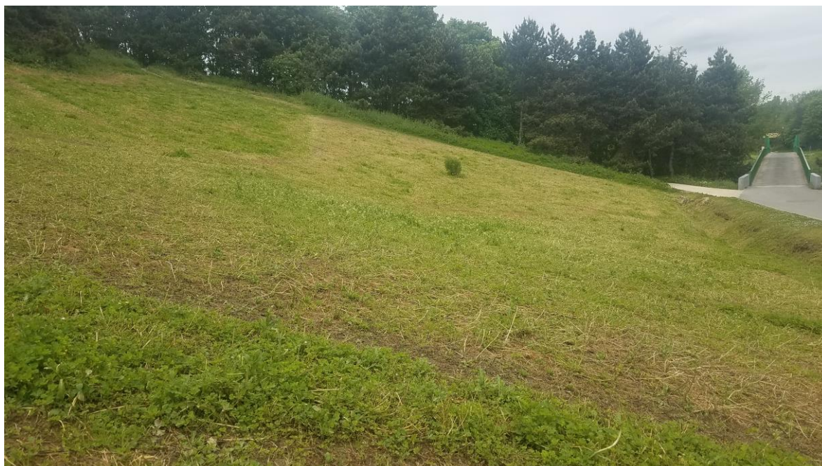
Figure 2 : Parcelles surpâturées dans le Parc Georges Valbon à la Courneuve (93)

La figure 2 montre une parcelle surpâturée dans le parc Georges Valbon, avec des zones où la hauteur d'herbe est inférieure à 4 cm et des zones de sol nu.