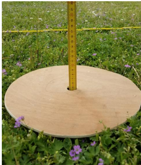
Figure 8 : Exemple d'herbomètre utilisé pour mesurer la hauteur en herbe d'une parcelle en sortie ou entrée de pâture

En phase de restauration, le pâturage peut être complété par une fauche ou un débroussaillage préalable. De cette manière, les ligneux subissent une double attaque et l'efficacité de la gestion s'en trouve améliorée.