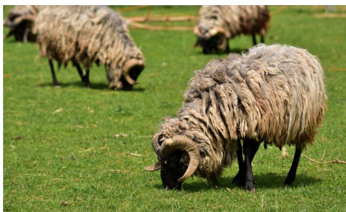
Figure 5 : Pâturage ovin - © Image libre de droit sur pixabay.com