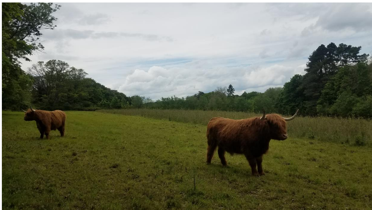
Figure 1 : Vaches Highland cattle pâturant dans le Réserve Naturelle des marais de Stors (95)

L'éco-pâturage est une excellente alternative à la gestion de ces espaces de façon durable d'un point de vue économique, social et environnemental.