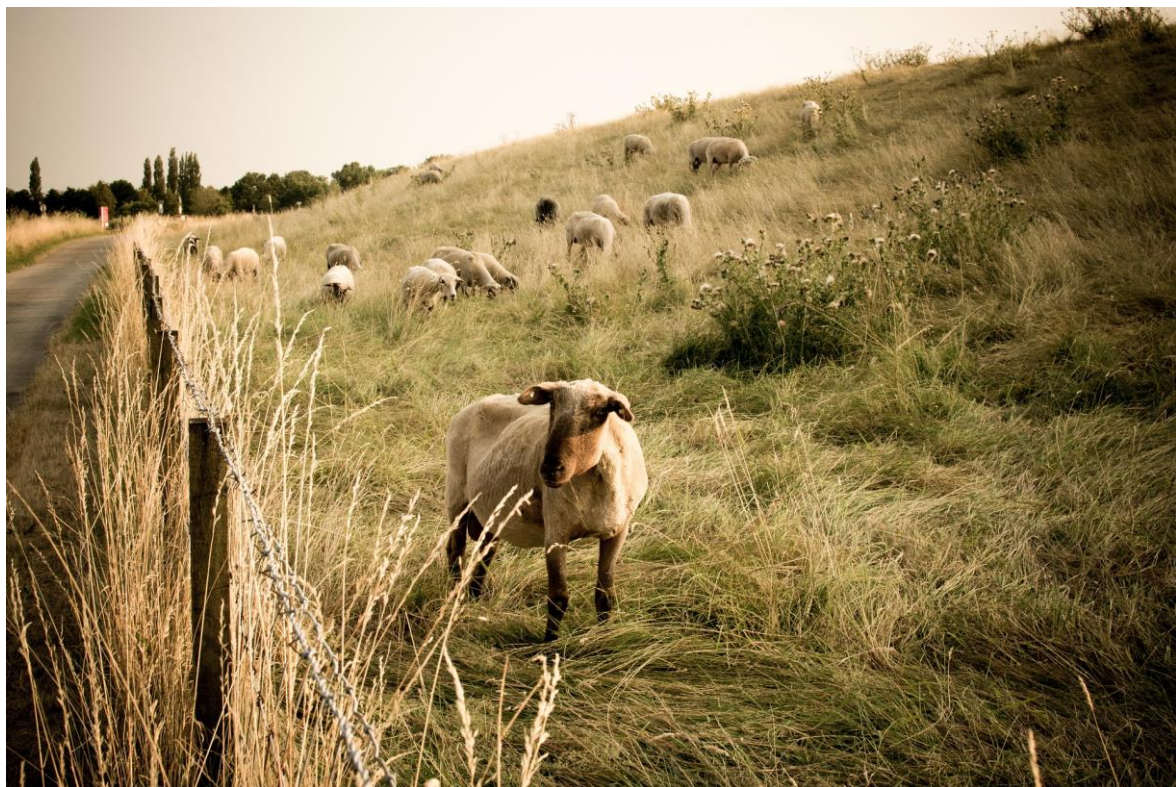
Figure 4 : Pâturage ovin

Dans certains contextes, le pâturage mixte peut être particulièrement intéressant. Dans le cadre de la restauration d'un site par exemple, les caprins qui consomment ligneux et jeunes pousses de ligneux peuvent pâturer au début de la restauration du site, pour ouvrir le milieu, puis des bovins peuvent prendre le relais par la suite (Öckinger et al., 2006). Les ânes, pouvant jouer un rôle de protecteur du troupeau, peuvent également être mélangés aux bovins et aux moutons. Il faut dans ce cas s'assurer du bon caractère des ânes sans quoi la cohabitation avec les moutons peut être compliquée. Le pâturage mixte est donc à privilégier dans certains cas, même s'il implique d'adapter les hauteurs de clôtures et de mangeoires et peut donc demander un temps d'installation plus long (UNEP, 2017).