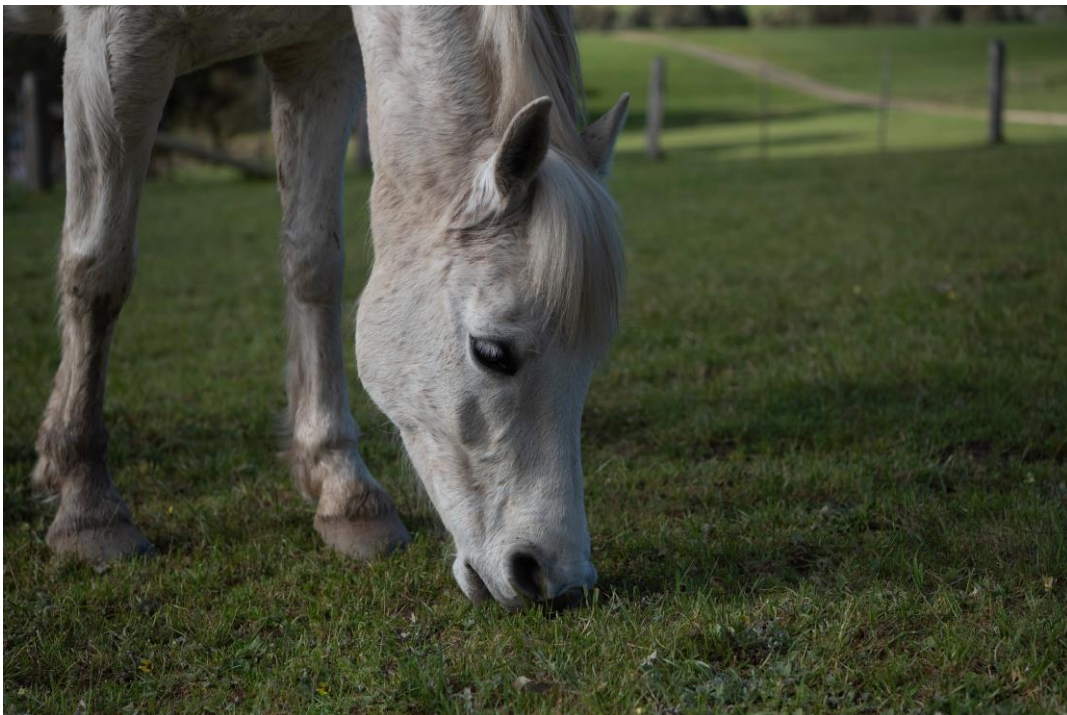
Figure 3 : Pâturage équin

Réalisé annuellement, le bilan de gestion permettra d'observer rapidement les changements à mettre en place l'année suivante pour trouver la gestion la plus adaptée à chaque parcelle.