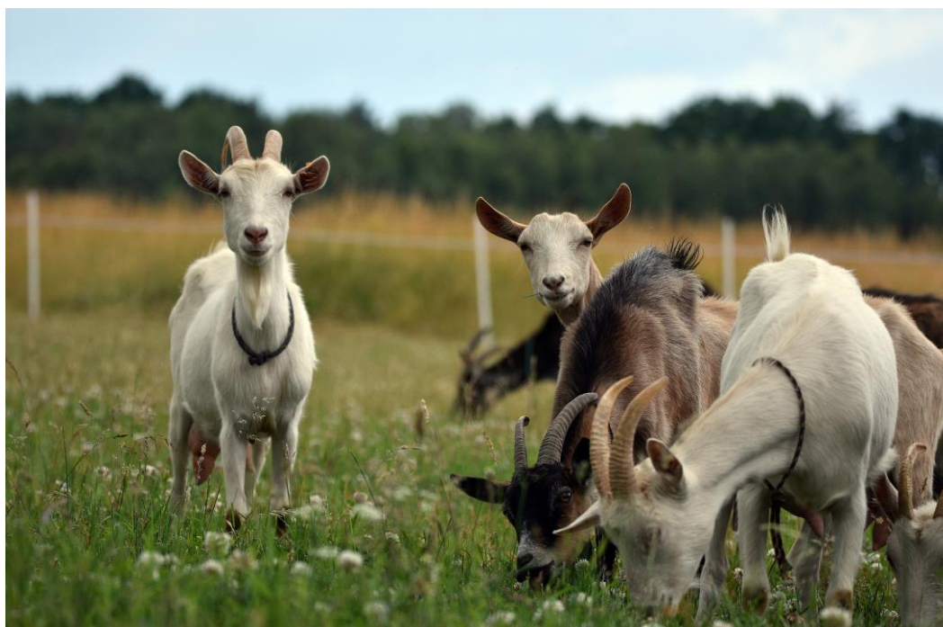
Figure 6 : Pâturage caprin