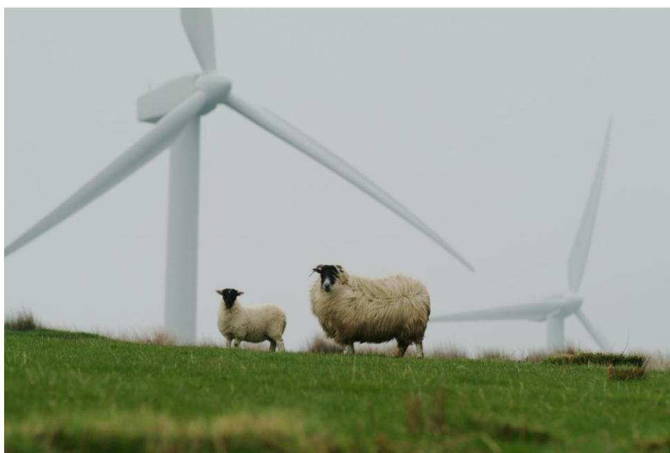
Figure 7 : Pâturage ovins

Chacun de ces modes de gestion a ses avantages et ses inconvénients. Le choix de l'un ou l'autre devra être adapté aux contraintes techniques, organisationnelles et financières propres à chaque organisme (Bourrel et al., 2019).