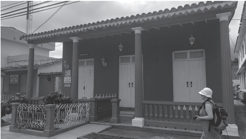
ILLUSTRATION 2. UNE CASA PARTICULAR FERMÉE À VIÑALES

À Viñales, l'essor de l'entreprenariat privé entraîne des recompositions de l'architecture du village. Au premier plan, on observe un chantier d'agrandissement de la maison.