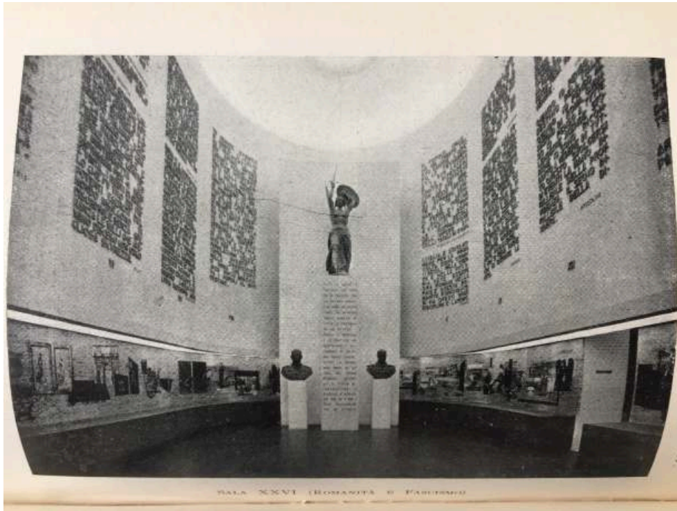
Image 3. Salle xxvi 55