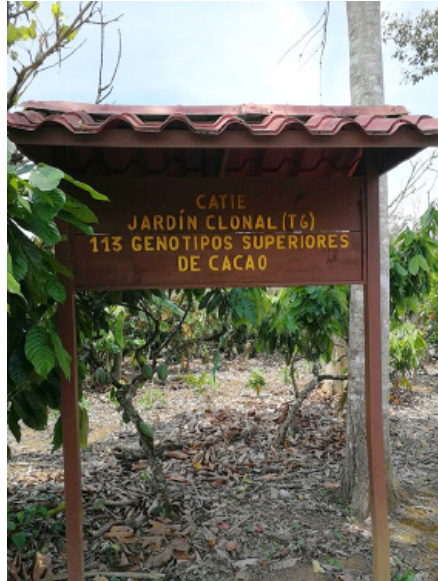
Figura 3. Jardín Clonal del CATIE en Turrialba, Costa Rica, 2018.

que actores no gubernamentales tomasen parte. El CATIE quedó a la cabeza de estos agentes de desarrollo. Simultáneamente, la naturaleza de la intervención del CATIE comenzó a cambiar dado que asumió un rol más activo en el desarrollo de proyectos de conservación y promoción del desarrollo sostenible en zonas de amortiguamiento de las áreas silvestres protegidas (CATIE y UICN 1992). El CATIE fue la entidad responsable de elaborar el primer plan de manejo del PILA en 1982, así como el primer plan de manejo de la Reserva de Biósfera La Amistad en 1991, la cual incorpora a los territorios indígenas talamanqueños. Entre 1985 y 1995, la institución también desarrolló el Proyecto Conservación para el Desarrollo Sostenible en América Central (OLAFO, 1989-1995), el cual tenía como propósito identificar actividades económicas que pudieran proponerse a las poblaciones de indígenas que habitaran en o cerca del PILA, con la intención de convencerlos de colaborar con la conservación. Precisamente, en el marco de este y otros proyectos paralelos, el CATIE comienza a concentrarse en la promoción de objetos específicos de intervención como la «agroforestería» (CATIE 1995).