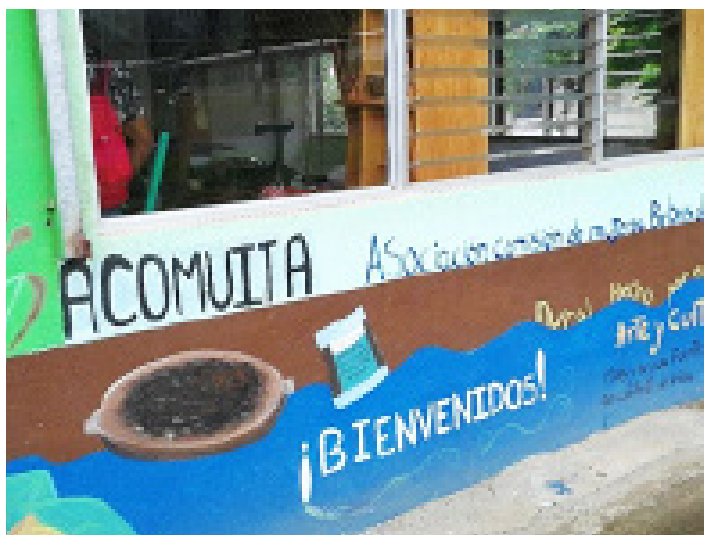
Figura 4. Sede de la Asociación Comisión de Mujeres Bribris de Talamanca (ACOMUITA), Suretka, Talamanca, 2018. Fotografía de los autores.

En la tabla 1, se ofrece un resumen de las 36 iniciativas públicas y privadas de fomento de cacao que se han implementado en Talamanca desde la década de 1960 y que fueron mapeadas para este artículo. Están clasificadas según el actor