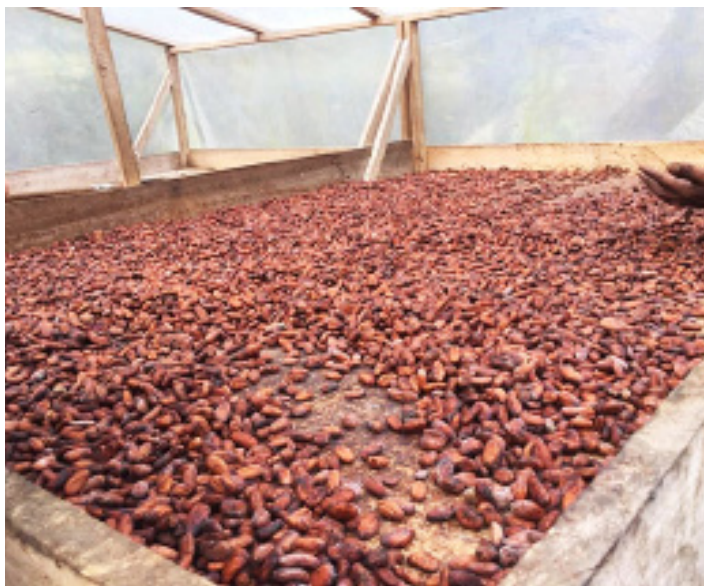
Figura 1. Cacao siendo secado al sol en Puerto Viejo de Talamanca, 2018.

sido considerada un foco particular de intervención (véase fig. 1), pues el rendimiento productivo aquí (100-150 kg por hectárea) está muy por debajo de las expectativas del MAG, que argumenta que, con el mejor material genético y cuidados adecuados (ambos diseñados por el CATIE) se podrían producir 1000 kg de cacao seco por hectárea (SEPSA 2017, 73). Ellos aducen que la baja productividad es producto de «que [los agricultores] no aplican suficiente tecnología, cuentan con materiales genéticos susceptibles a enfermedades, de baja producción y muchos productores han sembrado en sus fincas con semilla no mejorada, sin evaluar su productividad» (SEPSA 2017, 73).