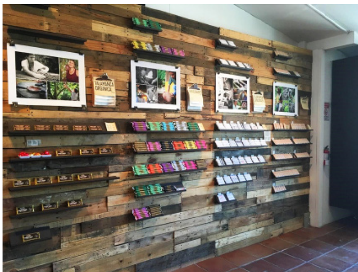
Figura 5. Tienda de chocolates locales en Puerto Viejo de Talamanca. 2019.

en el año y se concentran en productores con quienes tienen convenios de compra y pueden financiar un manejo adecuado de sus fincas para garantizar calidad. Dado el costo —en insumos y mano de obra—, para hacer esto solo unos pocos indígenas estarían en condiciones de producir en esta cadena particular. Además, importa decir aquí que, si bien el actual Plan Nacional de Cacao del MAG —a ejecutarse entre 2018 y 2028— señala el interés de que Costa Rica desarrolle cacao de alta calidad como su elemento diferenciador, esta nunca ha sido la apuesta nacional, incluso en el último ciclo de auge del cacao durante la década de 1960, y difícilmente se logrará alcanzar una reputación como esa hoy, considerando que el cacao exportado anualmente por Costa Rica se estima en menos de un 5 % del que se exportaba en 1963 (Picado Umaña, Hernández Aguirre y Porras 2017).