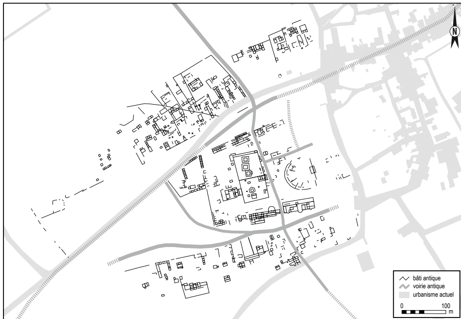
^ Plan général de l'agglomération antique d'Amel, établi d'après les fouilles, les prospections aériennes et géophysiques (DAO : S. Ritz)

fondé à l'époque romaine et autour duquel s'est ensuite développé un habitat groupé adoptant une organisation et un éventail de modèles architecturaux typiques des établissements ruraux de la région (Ritz 2020, p. 357-368). On y retrouve des constructions modestes et espacées reprenant le plan des bâtiments techniques ruraux, mais aussi quelques ensembles plus complexes, rassemblant une résidence en fond de parcelle, devant laquelle se développent deux ailes de bâtiments techniques encadrant une cour, selon un modèle architectural identique à celui des petites villae . Cette dichotomie architecturale très marquée semble avoir une valeur fonctionnelle : on voit mal, en effet, comment des répertoires architecturaux aussi différents et pourtant très homogènes au sein de chaque site, à 1,5 km de distance et à la même époque, pourraient s'expliquer autrement que par des fonctionnalités socio-économiques différentes. Une série d'indices mobiliers et immobiliers permettent de proposer que les activités agropastorales tenaient une place inhabituellement importante, quoi que pas exclusive, dans les quartiers urbains d'Amel. Le parcellaire se distingue aussi très nettement de ce qui s'observe dans la plupart des agglomérations : aux habituelles parcelles laniérées, occupées par des maisons en bandes mitoyennes, se substituent