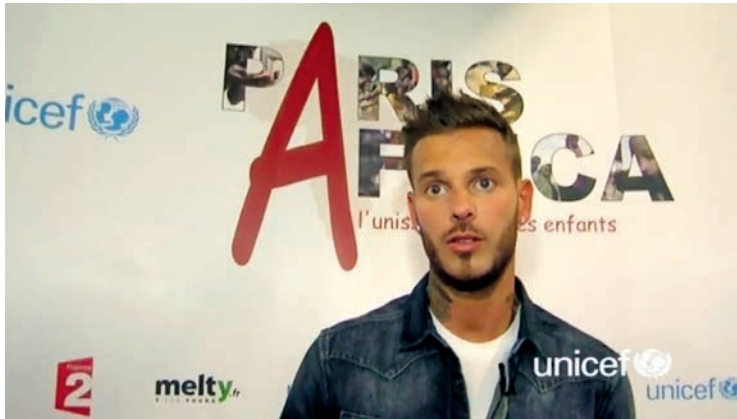
Fig. 4 Capture d'écran de la vidéo du témoignage de M Pokora.