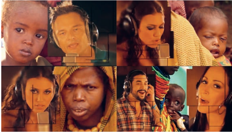
Fig. 3 Collage de quatre captures d'écran du vidéoclip Des ricochets .

humanitaire : le personnel soignant en mission et les victimes secourues. Paradoxalement, les victimes invoquées dans les paroles étaient absentes des vidéoclips. Cependant, ces deux figures médiatiques étaient présentes dans les journaux télévisés, lesquels fonctionnaient comme des espaces de référence pour les promoteurs des chansons humanitaires.