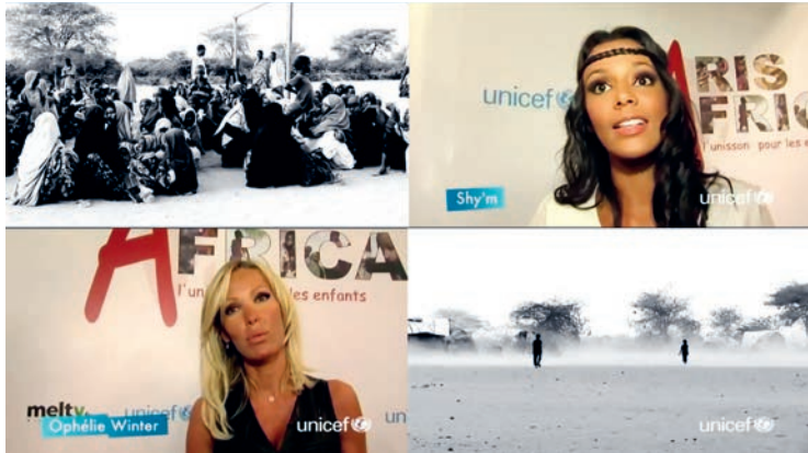
Fig. 5 Collage de quatre captures d'écran de la vidéo du making-of.

des artistes est de « mener une information à bien, d'essayer de toucher les gens et de les sensibiliser » ; il s'agirait pour lui « d'un cas de conscience » 34 . Pour l'animatrice de télévision et chanteuse française Shy'm, cette sensibilisation passe par « un tube que les gens aiment écouter et aient envie d'acheter aussi », dans le but « qu'on ait envie de chanter et de danser dessus tout en ayant reçu le message » 35 . Enfin, la chanteuse et actrice franco-néerlandaise Ophélie Winter affirme que la chanson va « toucher les gens et c'est toujours mieux de les toucher en chantant qu'en leur prenant la tête en étant sérieux et tristes » 36 . Le message est clair : chanter, danser et ne pas se prendre la tête avec des questions sérieuses qui pourraient nous attrister.