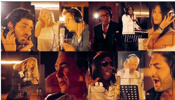
Fig. 2 Collage de quatre captures d'écran du vidéoclip Des ricochets .