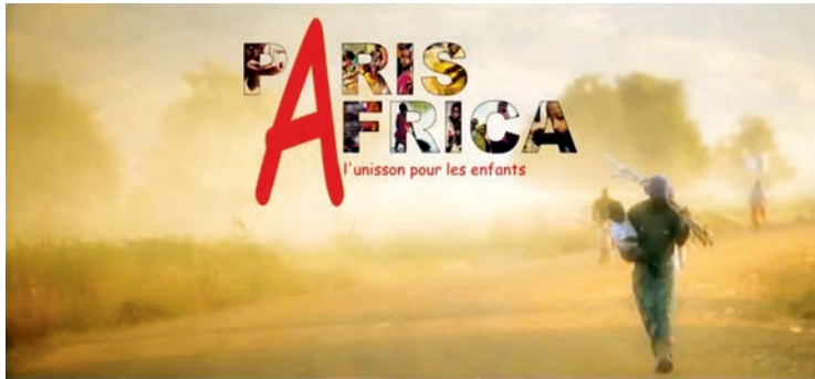
Fig. 1 Capture d'écran du début du vidéoclip Des ricochets .

question de produire d'abord le vidéoclip qui serait à la base de la campagne de communication et de marketing. La différence est significative puisque le tournage du vidéoclip permettait une maîtrise plus fine des récits, des discours et des images qui accompagnaient la campagne médiatique 15 .