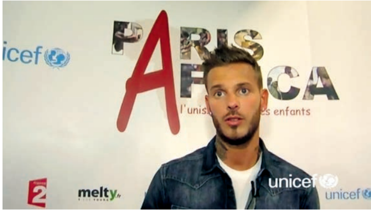
Fig. 4 Capture d'écran de la vidéo du témoignage de M Pokora.