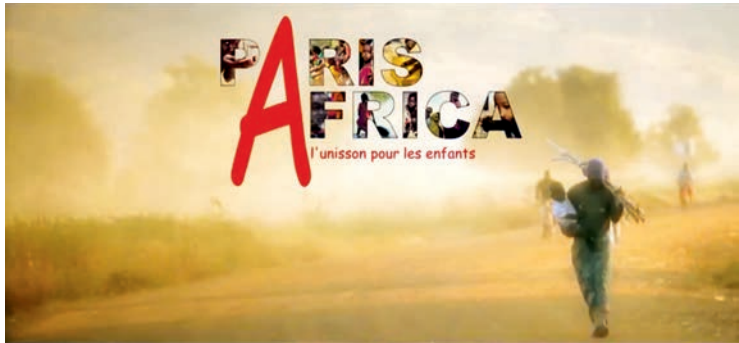
Fig. 1 Capture d'écran du début du vidéoclip Des ricochets .