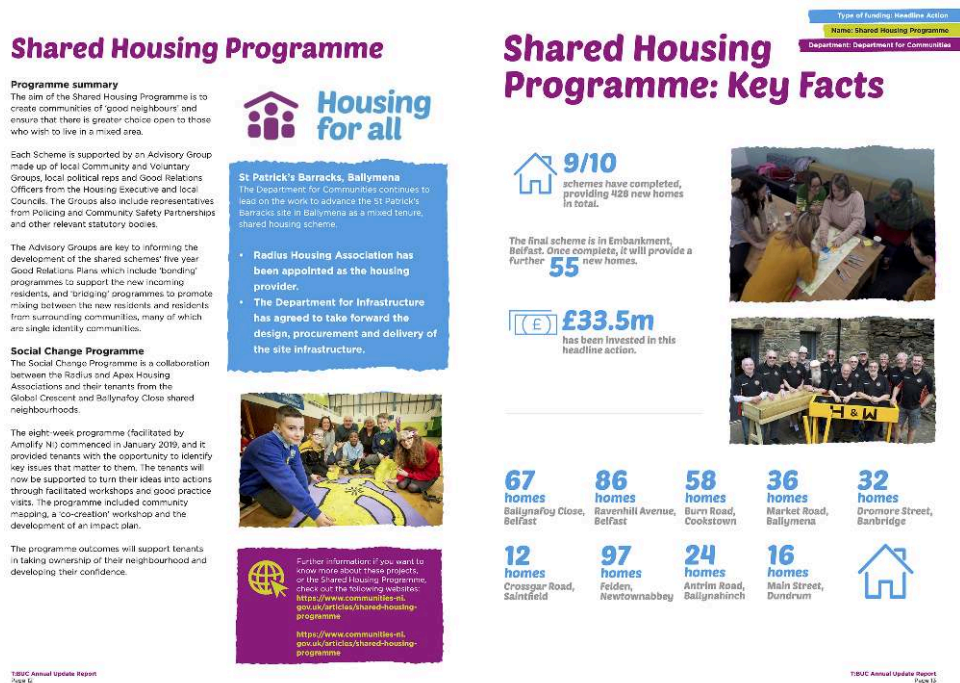
Figure 3. Rapport de l'année 2018-2019 de l'exécutif nord-irlandais sur la politique T:BUC

Source : Northern Ireland Executive, 2019, Together Building a United Community Strategy Annual Update 2018/2019 , 36 p.