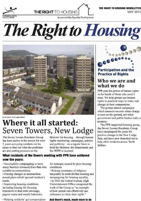
Figure 1. La newsletter de Participation and Practice of Rights sur le « droit au logement » datant de mai 2013

Source : Participation and Practice of Rights, May 2013, The Right to Housing newsletter, 6 p.