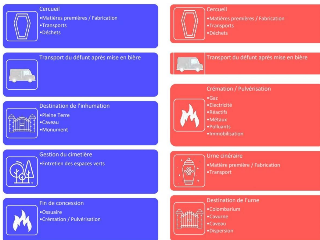
Figure 1. Inhumation (en bleu) vs. crémation (en rouge) : deux chaînes de valeur singulières