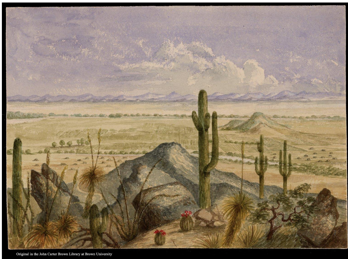
Imagen 1: BARTLETT John Russell, Arizona View overlooking Pinto village , 1852 2 . Acuarela. (25,14 x 35,30 cm). [The John Carter Library, Digital Collections, https://jclibrary.org/collection/digital-images ]

Las balas penetraban espaldas, rostros, muslos y las personas se desvanecían entre ramas de cactus y piedras que silenciosas guardan historias del desierto que es lozano en paisaje de postal