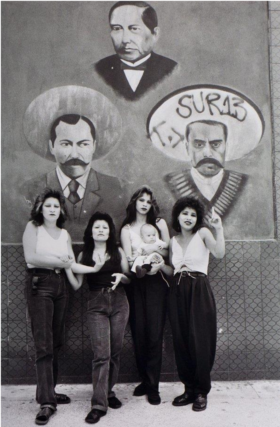
Imagen 4: ITÚRBIDE Graciela, Cholas , White Fence, East Los Angeles, 1986 © Graciela Iturbide.

Fronteriza y aquellos/as que pertenecen a las clases acomodadas y que desprecian al migrante pobre.