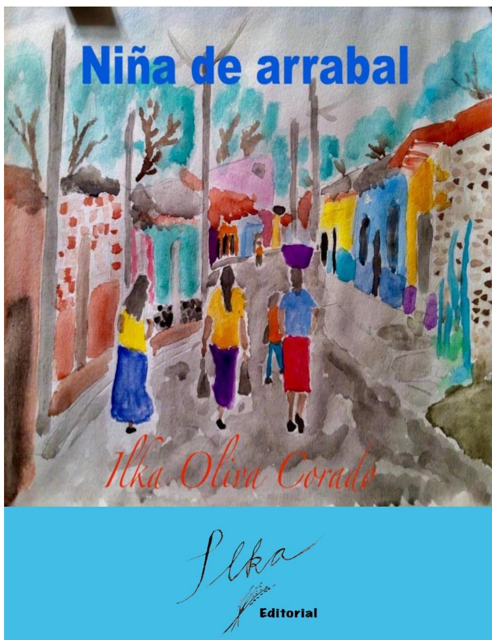
Imagen 2 : OLIVA-CORADO, Ilka, portada y libro, Niña de Arrabal , 2016, cortesía de la autora.

Ilka: Te diré algo, crecí en un arrabal, un día comenzaron a desaparecer varios jóvenes que eran señalados por pertenecer a maras. En las famosas limpiezas sociales que realiza el gobierno. Las maras son grupos de amigos, tú tienes 3 o 4 amigas con las que siempre andan en grupo y entonces ya son una mara. En el arrabal las maras son así, son los grupos de amigos que siempre andan juntos, aunque la palabra tiene su raíz con grupos de jóvenes salvadoreños que vivieron en Estados Unidos y cuenta la historia oficial que fueron deportados masivamente por cometer actos delictivos. Desde entonces a los jóvenes del arrabal, tatuados, con apariencia de asaltantes (claro, volvemos a lo mismo, con los patrones de crianza de un sistema patriarcal y racista y clasista) se les llama maras.