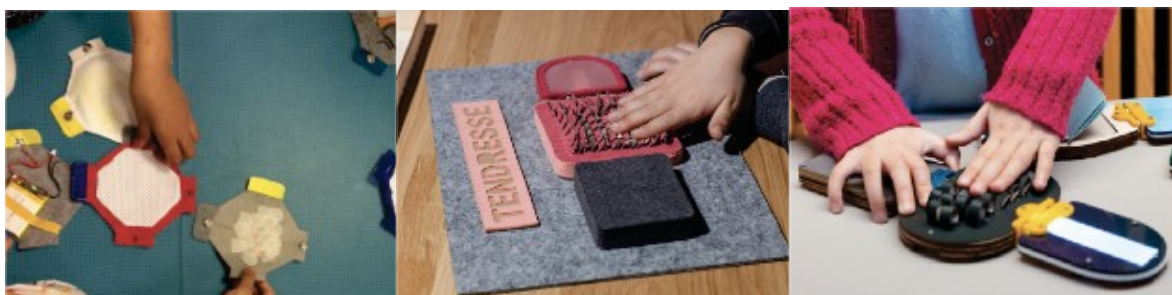
Figure 3 : Dans l'ordre, les 3 versions du dispositif de Learning Matters (V1, V2, V3 finale)

Grâce à ces dernières modifications, le projet s'inscrit dans la philosophie de transmission ouverte (ou open-source ), puisque les dispositifs sont facilement reproductibles en fablab ou tiers-lieu de fabrication numérique.