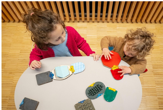
Figure 4 : Le projet Learning Matters utilisé par deux enfants de 3 et 5 ans, dans la troisième phase du scénario : l'interaction gestuelle

Ce scénario a fait l'objet d'expérimentations en maternelle lors de chaque phase d'itérations du dispositif pendant le processus de conception. C'est sa mise en œuvre qui a permis d'identifier les améliorations du dispositif et d'aboutir à une troisième version dite « finale » (cf. 3. Processus de conception ).