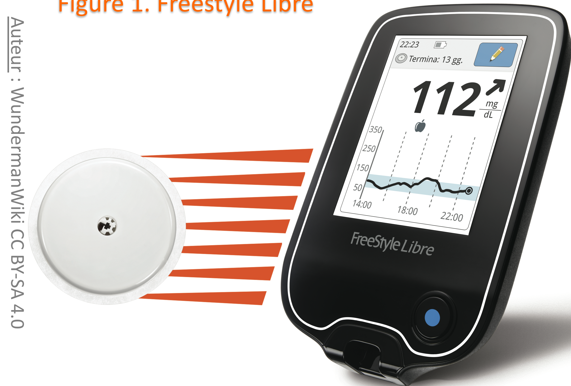
Figure 1. Freestyle Libre

L'ASG entraîne des perceptions négatives (5) : impressions de gravité de la maladie, répercussions sur la vie quotidienne, difficultés situationnelles, douleurs et stigmates, sentiment de culpabilité, sentiment d'échec, frustration.