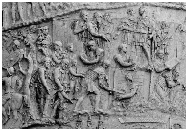
Fig. 3: colonne Trajane, scène 39

Cette seconde campagne (sc. 31-47) débute par une attaque dace et sarmate sur des forts romains (sc. 31-32). La contre-attaque romaine met en fuite les ennemis, mais une seule scène