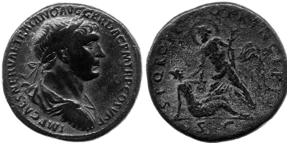
Fig. 6: Sesterce de Trajan: avers: buste de Trajan; revers: Dieu Danuvius maîtrisant la Dacie (104-107 après J.-C.)

En élargissant le corpus aux monnaies et aux textes, il est possible d'esquisser quelques constatations iconographiques. Seul Trajan est représenté comme recevant les suppliques ou ambassades: il est le détenteur de l' imperium , c'est donc à ce titre de représentant de Rome qu'il reçoit les délégations et les suppliques. Remarquons cependant un Dace qui supplie un auxiliaire en pleine bataille (sc. 111) 55 , image rare sur ce monument: mais il ne semble pas que le soldat soit disposé à la clémence, pas plus que celui de la sc. 40 (4e campagne). Un autre Dace, à la fin de la frise (sc. 151), est représenté genou au sol, avec son bouclier au bras gauche, mais la main droite levée vers un auxiliaire, lequel a le bras droit levé: là encore, le contexte est une bataille, et il paraît clair que le Dace au sol va être achevé. On peut retrouver la posture sur un sesterce de 104-107, contemporain donc de la deuxième guerre dacique, qui montre le dieu Danube saisissant la Dacie à la gorge (fig. 6) 56 : le geste de la main de Dacia , qui touche le coude du dieu, ne paraît guère arrêter l'élan de ce dernier. Bref, seuls les Daces admis en présence de Trajan peuvent espérer bénéficier de la clementia romaine, du moins si le processus est fait hors contexte immédiat de bataille.