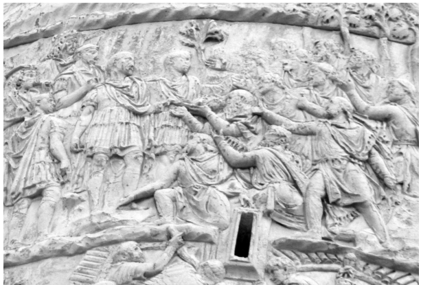
Fig. 5 : colonne Trajane, scène 123.

Après l'incendie de leur capitale par les Daces (sc. 119) puis la grande scène de suicide collectif et d'abandon de Sarmizegetusa (sc. 120-123), les scènes de supplication à Trajan se multiplient. Dans celles-ci, les Daces sont tous sans armes. On voit d'abord dix comati (sc. 123, fig. 5), mais le bras droit de Trajan reste le long de son corps, côté opposé aux Daces. Lorsque trois pileati se pressent à ses pieds (sc. 130), son bras demeure cette fois replié 53 : aucun geste dans leur direction... Il en est de même vis-à-vis des six pileati (sc. 141 54 ), dont un à ses pieds, qui se présentent devant lui juste après une autre scène de suicide collectif dace (sc. 140) : le bras de Trajan est replié, il n'étend pas sa protection sur eux. Suivent diverses scènes de capture de prisonniers (sc. 146, 148-150, 152), mais surtout le suicide de Décébale (sc. 145) et la présentation de sa tête et de sa main droite à l'armée (sc. 147), qui marquent la fin du royaume dace.