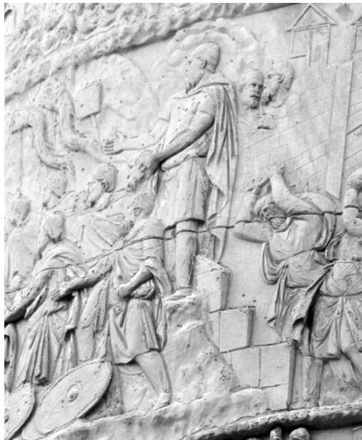
Fig. 4-B: colonne Trajane, scène 75: détail Décébale

Derrière (sc. 76), tandis que l'on détruit une fortification, figurent des femmes et enfants, mais aussi des hommes daces et du bétail. S. Settis y voit une foule en train d'évacuer une partie du territoire 48 , mais on a vu d'autres scènes où des Daces avec femmes et enfants se réfugiaient auprès de Trajan (sc. 39 fig. 3 ci-dessus). Quoi qu'il en soit, dans cette scène, les personnages ne sont pas menacés par les Romains.