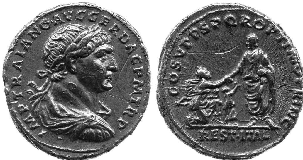
Fig. 7: Aureus de Trajan: avers: buste de Trajan; revers: Italia agenouillée, main droite touchant celle de l'empereur debout, et deux enfants sous son bras (111 après J.-C.).

mutuelle, du lien de pietas et de fides qui unit Trajan et les citoyens. Les alimenta protégeaient les jeunes citoyens romains d'Italie : en les instituant, Trajan agissait en tant que Pater Patriae et au nom d'une pietas erga parentes étendue à la péninsule entière 86 . Ce lien est d'ailleurs exprimé par un aureus de Matidia : elle y figure entourée de deux enfants, avec la légende PIETAS 87 .