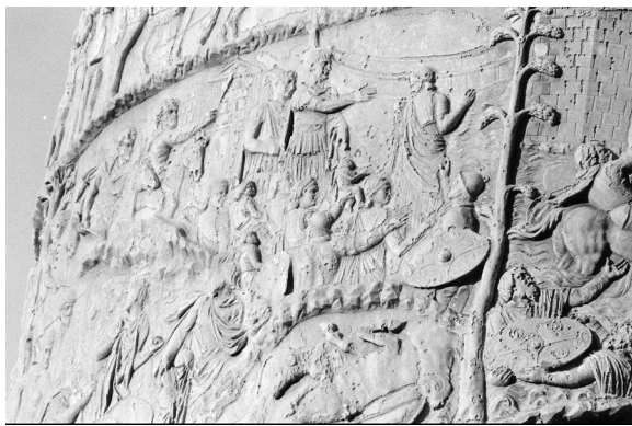
Fig. 2 : colonne Trajane, scène 30.

Seule la dernière scène (sc. 30, fig. 2), complexe, montre dans la partie supérieure Trajan en compagnie de femmes daces et d'enfants, avec en arrière-plan un navire : son geste de la main, le regard et le mouvement du bras de la femme à sa hauteur (elle porte un enfant), paraissent signifier