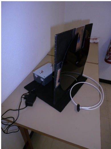
Fig. 4. Plateau tournant commandé par un mouvement de bras.

Ce plateau tournant permet à l’adolescent de faire un choix d’images pour communiquer à partir du seul mouvement d’un bras qu’il peut contrôler depuis que ce geste athétosique est perçu de manière positive. Lorsque le bras passe devant un capteur de proximité, le plateau tourne d’un quart de tour et une image ou un pictogramme vient se placer dans une fenêtre. (Fig.4)