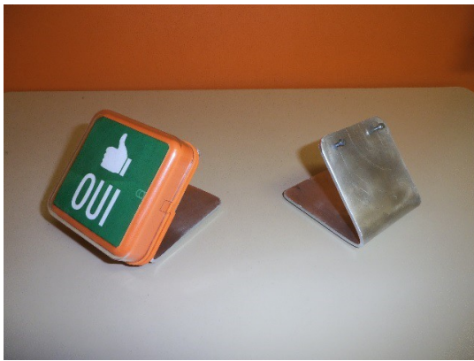
Fig. 6 : Support de contacteur incliné