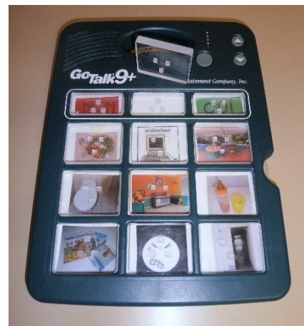
Fig. 3. Amélioration de l'ergonomie d'une synthèse vocale GoTalk.

La synthèse vocale GoTalk permet à certains enfants polyhandicapés de communiquer en appuyant sur une touche d'un clavier à laquelle est associée une photo, une image, un pictogramme. Cependant pour certains enfants, un positionnement précis du bout du doigt au centre de la touche s'avère difficile. C'est pour cette raison que la thérapeute a eu l'idée d'ajouter dans chaque case, une touche en plastique transparent (pour ne pas cacher l'image associée) avec 3 points d'appui pour pouvoir valider dans toutes les situations (appui décentré, latéral,...). De plus, ces touches sont affleurantes ce qui évite à l'enfant des efforts de positionnement pour communiquer plus facilement (Fig. 3).