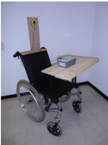
Fig. 1. Synthèse vocale commandée par des mouvements de tête.

Le projet s'est orienté vers l'apprentissage de l'utilisation d'un contacteur relié à un boîtier vocal à l'aide de mouvements de tête afin de déclencher de la musique ou des phrases. L'adolescent peut ainsi communiquer par des mouvements de tête avant-arrière qu'il est capable de contrôler grâce au travail de l'équipe d'accompagnement (Fig. 1). Le contacteur doit être placé derrière sa tête et il faut lui expliquer qu'il doit redresser la tête pour l'utiliser correctement.