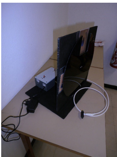
Fig. 4. Plateau tournant commandé par un mouvement de bras.

Ce plateau tournant permet à l'adolescent de faire un choix d'images pour communiquer à partir du seul mouvement d'un bras qu'il peut contrôler depuis que ce geste athétosique est perçu de manière positive. Lorsque le bras passe devant un capteur de proximité, le plateau tourne d'un quart de tour et une image ou un pictogramme vient se placer dans une fenêtre. (Fig.4)