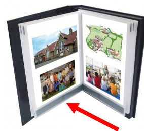
Fig. 7 : Cahier de communication parlant vendu dans le commerce

L'amélioration de l'ergonomie des touches d'un cahier de communication parlant est envisagée pour faciliter son utilisation. Les touches actuelles sont petites et demandent une finesse gestuelle et une dextérité manuelle que peu d'enfants polyhandicapés possèdent.