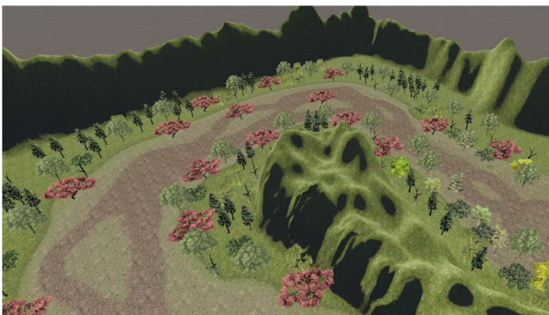
Fig. 8 : Capture d'écran du jeu

Le premier que nous développons actuellement pour ce projet, dans le prolongement de l'expérience acquise au laboratoire I3M [12], permet à des enfants d'évoluer dans une forêt où ils trouveront des objets à ramasser au cours de leur promenade. L'objectif est de permettre au psychiatre accompagnant les enfants d'obtenir des informations pertinentes sur leurs préférences, en fonction de la nature et des caractéristiques des objets qui sont choisis. Le psychiatre voudrait en profiter pour améliorer la communication avec les enfants (Fig. 8)