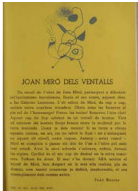
Imagem nº 4 – Desenho de Juan Miró acompanhado de texto de Joan Brossa na revista Dau al Set (dezembro de 1949)

Já Miró, a quem os artistas de Dau al Set , burlando as proibições franquistas, puderam conhecer pessoalmente na ocasião de uma visita a seu estúdio, aparece na revista na edição de maio de 1949, com um texto de Joan Brossa em sua homenagem.