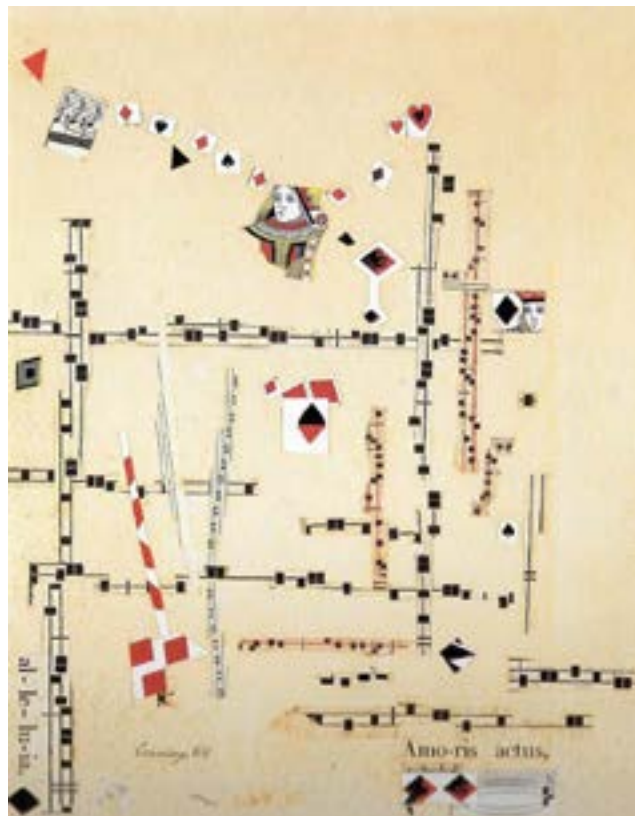
Imagem nº 6 – Al-le-lu-ia, Amo-ris actus, 1964; colagem sobre papel; 35,5 x 27,5 cm, F.C.M., V. N. Famalicão.

Para finalizar com um trabalho plástico de Mário Cesariny, gostaria de mencionar a colagem «Al-le-lu-ia, Amo-ris actus», de 1964, em que o poeta explora a dimensão visual e, ao mesmo tempo, musical da poesia. Nessa imagem, percebemos a presença da Dama e do Valete, assim como de naipes das cartas de baralho. Na obra, predominam as cores vermelha e preta, e nela também se distinguem alguns fragmentos de partituras. Os outros elementos, ao associarem-se, evocam uma nova partitura, assemelhando-se a traços que foram decompostos a partir das próprias cartas de baralho, fragmentos de outro contexto que, agora reagrupados, configuram uma nova imagem. Segundo Michele Coutinho Rocha, trata-se de uma «alusão interdiscursiva» à obra de Joan Brossa 23 . Não sei se é possível afirmar que exista realmente uma alusão interdiscursiva à obra de Brossa, mas o fato é que há uma nítida correspondência entre os dois poetas no que diz respeito à compreensão do ilusionismo como possibilidade poética.