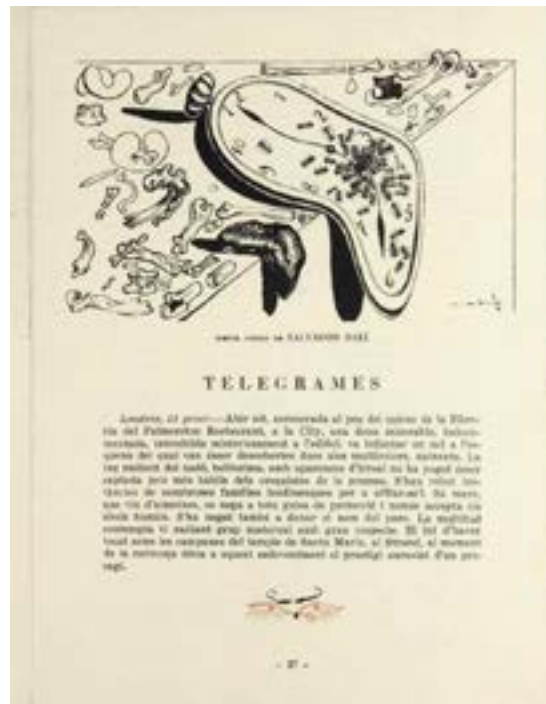
Imagem n° 2 – Desenho de Salvador Dali na revista Dau al Set (dezembro de 1948)

No caso da revista catalã, esse modo de sair pela tangente significava, em certa medida, retomar o projeto vanguardista de Picasso, Dalí e Miró, como aponta Lourdes Cirlot 11 , sendo que os dois últimos estarão efetivamente presentes nas páginas da revista. Com relação a Dalí, na edição de dezembro de 1948, aparece um desenho inédito do pintor encabeçando os «Telegrames» de J. V. Foix.