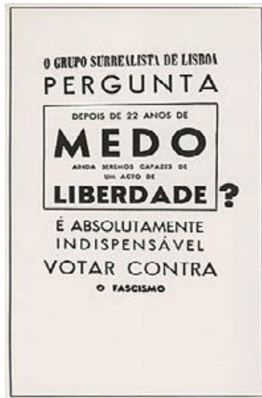
Imagem nº 1 – Capa censurada do catálogo da exposição do Grupo Surrealista de Lisboa

surrealista é inseparável do próprio gesto de atuação política, a capa do catálogo na verdade apresentava um texto de intervenção, no qual se lia uma mensagem cujo objetivo era aconselhar o voto no general Norton de Matos, candidato da oposição: