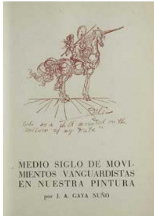
Imagem nº 3 – Desenho de Salvador Dalí na revista Dau al Set (dezembro de 1950)

Já Miró, a quem os artistas de Dau al Set , burlando as proibições franquistas, puderam conhecer pessoalmente na ocasião de uma visita a seu estúdio, aparece na revista na edição de maio de 1949, com um texto de Joan Brossa em sua homenagem.