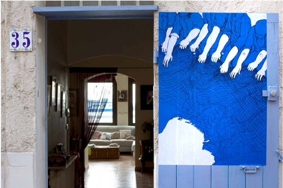
Figure 2. Coopérative Hôtel du Nord ©. Projet artistique Bel Vedere , Stéphanie Nava

et élus est restée très faible, voir conflictuelle comme souvent en Europe. Les motifs locaux sont multiples comme le projet immobilier du maire de Viscri qui menace les prés communaux, le scandale du projet Moise à Venise qui a abouti à l'arrestation du maire en 2014, le sentiment d'abandon des quartiers nord de Marseille qui a été au cœur des dernières élections municipales de 2013 ou encore la mobilisation citoyenne inhabituelle à Pilsen des résidents contre l'autorisation donnée par la municipalité à un nouveau supermarché. Dans tous ces cas, la société civile remet en doute la capacité des institutions et de ses élus à défendre l'intérêt général. Ces processus participatifs sont souvent adoptés sous la pression citoyenne (promesse électorale) ou européenne sans qu'ils soient pleinement partagés localement. D'un côté l'administration publique n'a pas confiance dans les capacités de la société civile à être ressource dans les processus dont elle a la charge et elle cherche essentiellement à mieux faire comprendre et accepter des choix qu'elle a déjà pris. La société civile quant à elle ne reconnaît plus l'administration publique et ses élus comme des interlocuteurs fiables. Le processus participatif institué s'impose alors de manière unilatérale et il est dans les contextes abordés refusé (Marseille), inappliqué (Venise), ignoré (Pilsen) ou incompris (Roumanie).