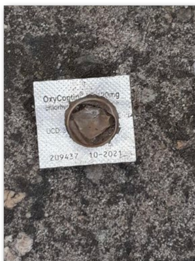
Photo de blister vide d'Oxycontin® trouvé dans un squat habité par des usagers en situation de grande précarité

« J'ai vu apparaître (...) l'Oxycontin®. (...) C'était très marginal, en fait, l'année dernière [2019] et l'année d'avant [2018], il y a deux ans qu'on l'a vu apparaître par le biais de blisters vides qu'on trouvait par terre. C'est toujours le cas. (...) Je trouve énormément de blisters d'Oxycontin® vides, notamment dans un squat sur la rive droite. »