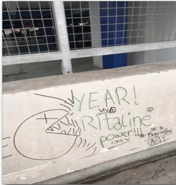
Tag sur un mur à proximité d'un squat mentionnant « Ritaline Power Crew !!! »

Concernant les benzodiazépines, la diffusion du Lyrica® ou du Rivotril® parmi les publics très précaires, tendance déjà décrite dans le rapport TREND portant sur 2019, s'est poursuivie. Des demandes de sevrage au Lyrica® ont été faites en 2020 : une médecin (CAARUD-CSAPA) rapporte ainsi le cas d'une patiente suivie au CSAPA « qui s'était sevrée à la méthadone avec du Lyrica® » et était en demande de sevrage de Lyrica®. Les usages de Rivotril® semblent avoir suivi la même tendance, même si ce médicament a été moins demandé que le Lyrica®. Une éducatrice de rue (CAARUD) parle ainsi de « fête du Rivotril® » au sein du public très précaires avec des pharmaciens qui appelaient les professionnels du CAARUD car « les usagers étaient des plombes » quand ils refusaient de leur fournir du Rivotril® en l'absence d'ordonnance. Cette éducatrice de rue affirme « l'importance qu'a pris le Rivotril® auprès des jeunes à la rue » et « la banalisation de l'injection de Rivotril® ».