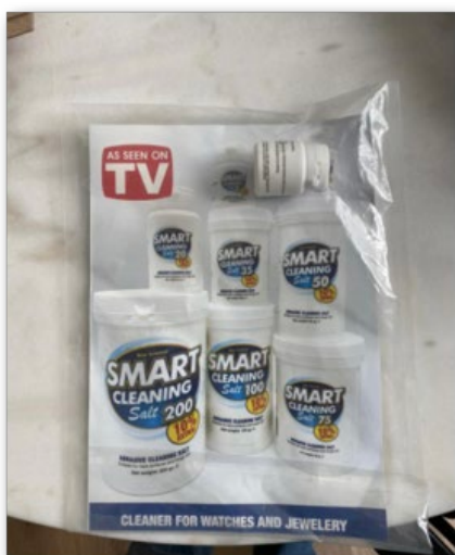
(3) De la 3-MMC vendue comme nettoyant pour bijoux