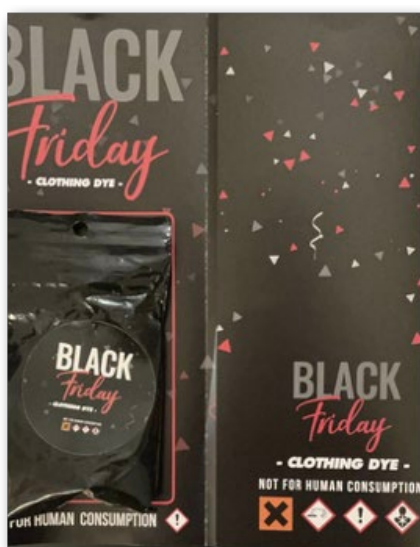
(1) Une offre « Black Friday » pour de la 3-MMC

Comme indiqué les années précédentes, la plupart des produits consommés en soirées chemsex sont achetés sur Internet (ce qui permet de se les procurer à un prix avantageux, mais comporte des risques d'escroquerie), ou auprès de revendeurs se fournissant sur le darkweb et le surface web et pratiquant le chemsex. Le réseau est ainsi présenté comme « complètement communautaire » par un chemsexeur. Ci-dessous, des photos d'offre de produits sur Internet et d'emballages de 3-MMC, présentée comme du désodorisant pour litière ou du nettoyant pour bijoux.