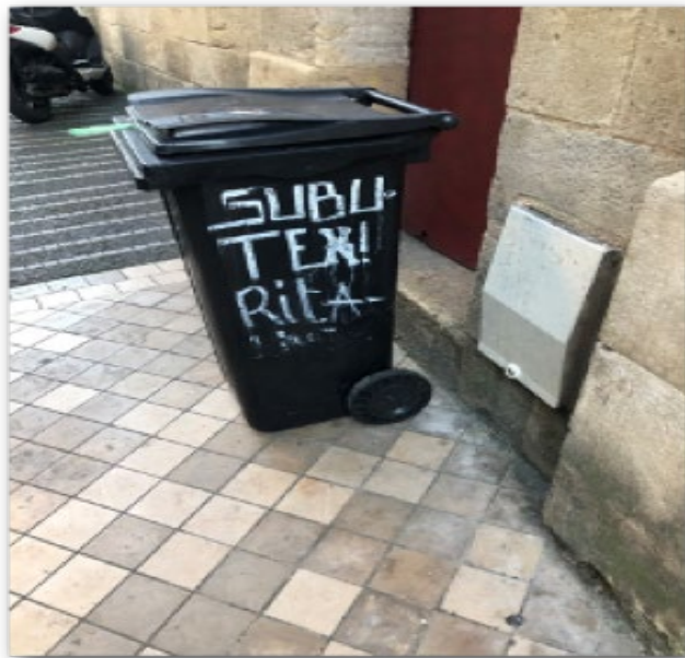
Tag sur une poubelle à côté d'un CAARUD mentionnant « Subutex ! Rita »

L'observatrice en espace urbain ainsi qu'une éducatrice de rue (CAARUD) ont pris plusieurs photographies de tags mentionnant la Ritaline®, présentées ci-dessous, et qui témoignent de la popularité du médicament au sein des populations usagères vivant à la rue ou en squats.