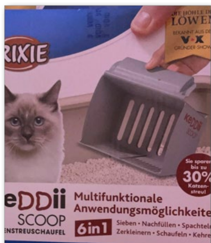
(2) De la 3-MMC vendue comme désodorisant pour litière