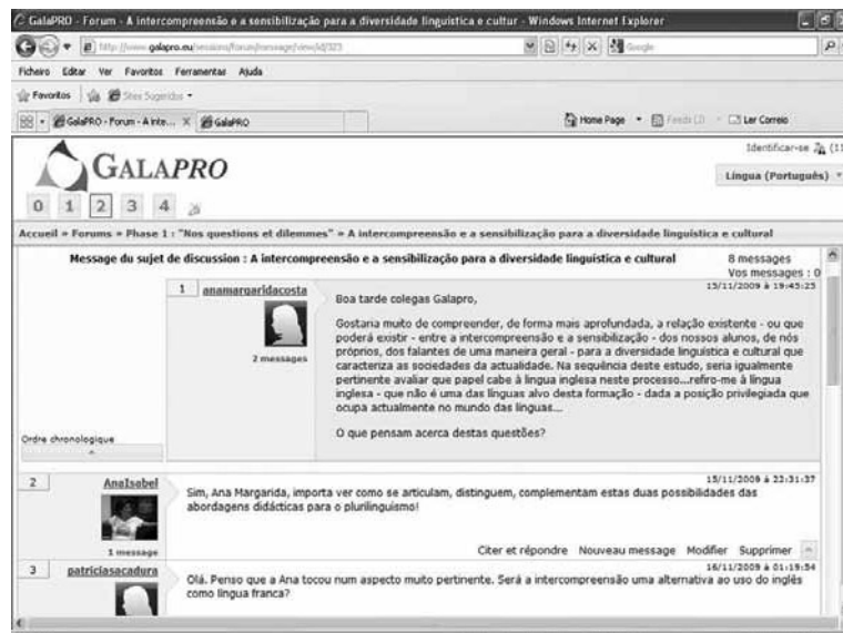
Figure 4 - Extrait d'un forum (Session 2)

On incite, en outre, à la discussion permanente, notamment dans les forums, des représentations, croyances et expériences.