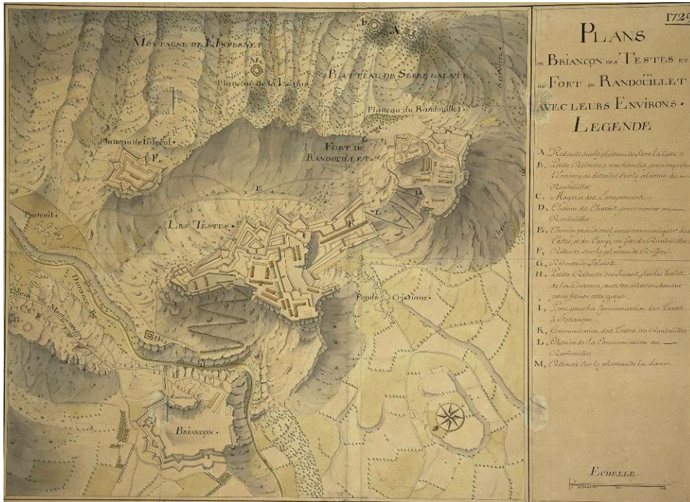
Fig. 4. - Plan des forts de Briançon au milieu du XVIII e siècle.