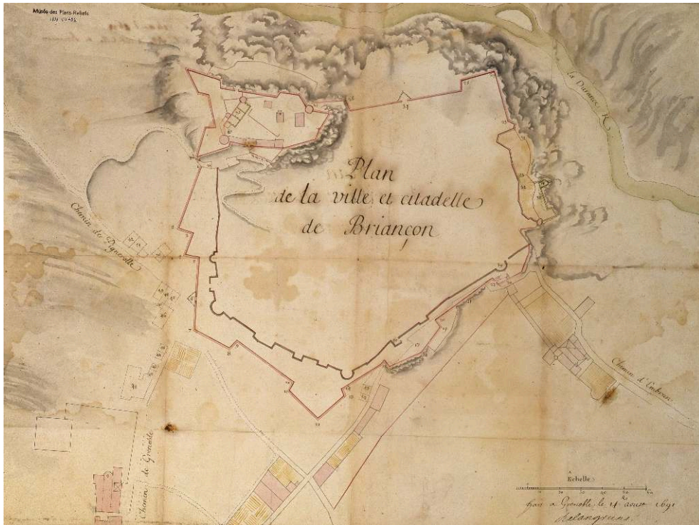
Fig. 2. - Plan de l'enceinte urbaine de Briançon en 1691 signé Delangrune.