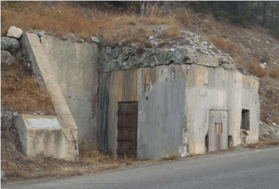
Fig. 10. - Barrage rapide de Montgenèvre.