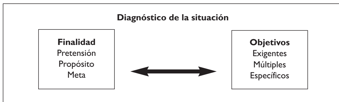
GRÁFICO II. Fases de la planificación de la actividad preventiva

Se podría definir esta fase de planificación como el «diagnóstico de las condiciones previas individuales y sociales –tanto de profesores como de alumnos–, al objeto de determinar, fundamentalmente, sus experiencias, su instrucción, sus necesidades, sus intereses y su situación socioambiental y laboral» (Ferrández y González Soto, 1992, p. 270). A partir del diagnóstico realizado por el equipo directivo del centro escolar, cabría destacar la definición de objetivos en función de la realidad del centro o aula y la finalidad perseguida. Estos objetivos deben ser: