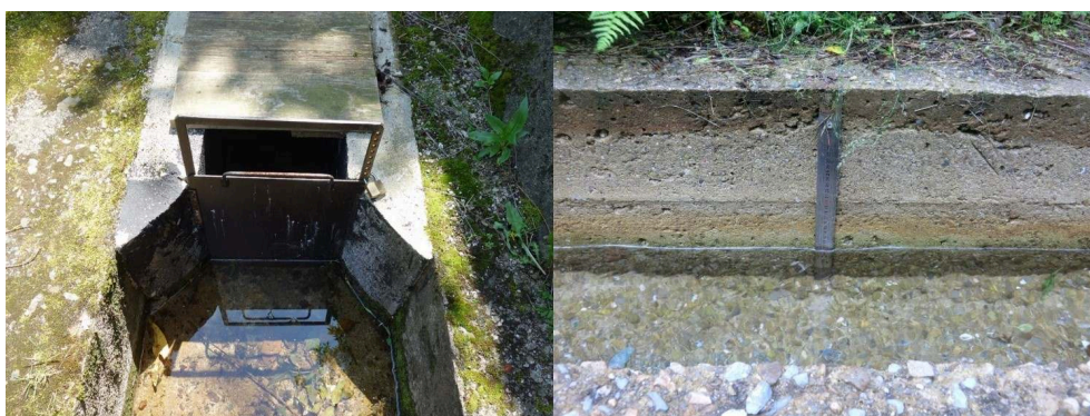
Figure 3. Dispositif de suivi et de contrôle des volumes prélevés.

3a. Martelière crantée servant à réguler le volume à l'entrée du béal. La martelière est équipée de 8 positions permettant de varier le volume d'eau dérivé. 3b. Echelle limnimétrique placée dans un tronçon bétonné sert à mesurer les hauteurs d'eau