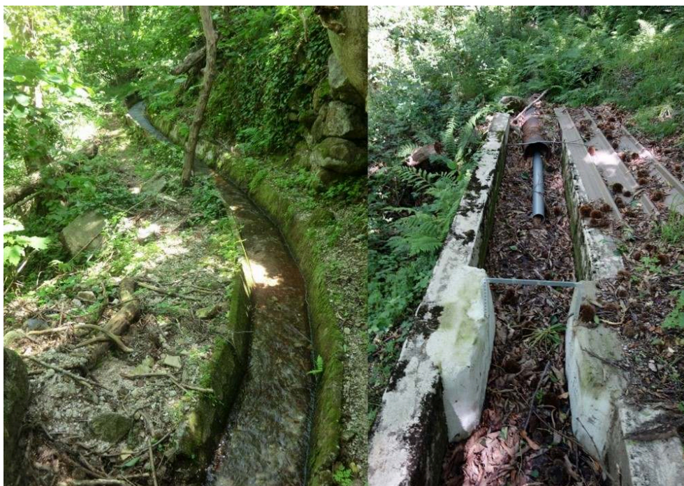
Figure 4. Violence esthétique faite aux béals .

4a. Le béal des Chambons à ciel ouvert et revêtu de buses en béton », 4b. Le béal des Plots illustre différentes phases de modernisation technique : pose d'un tuyau, construction du tronçon en béton pour la mesure du débit, ancien emplacement d'une vanne crantée, canal enterré.