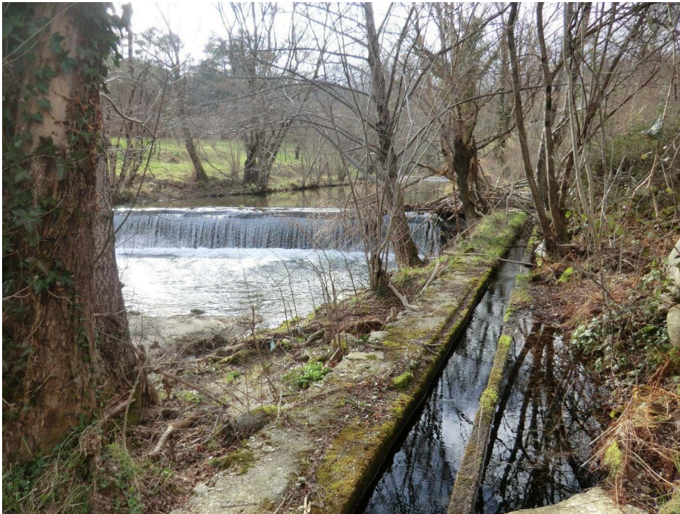
Figure 5. Béal longeant la Gardonnette et illustrant la proximité entre canaux et rivière.