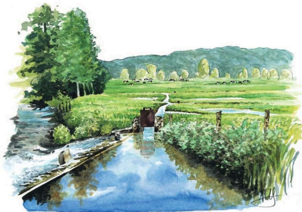
Figure 1. Illustration d'un canal gravitaire.

Au premier plan, un seuil dérive les eaux de la rivière. Au second plan, la vanne est ouverte. Elle permet de réguler les débits d'eau vers les canaux primaires et secondaires qui arrosent les prairies