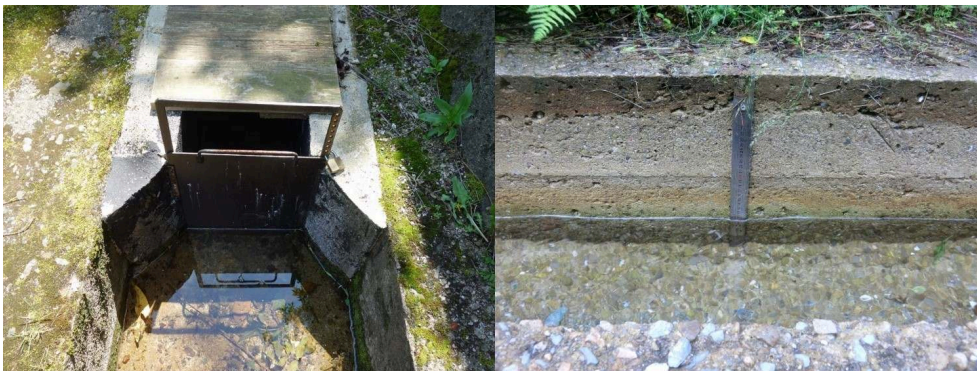
Figure 3. Dispositif de suivi et de contrôle des volumes prélevés.

3a. Martelière crantée servant à réguler le volume à l'entrée du béal. La martelière est équipée de 8 positions permettant de varier le volume d'eau dérivé. 3b. Echelle limnimétrique placée dans un tronçon bétonné sert à mesurer les hauteurs d'eau