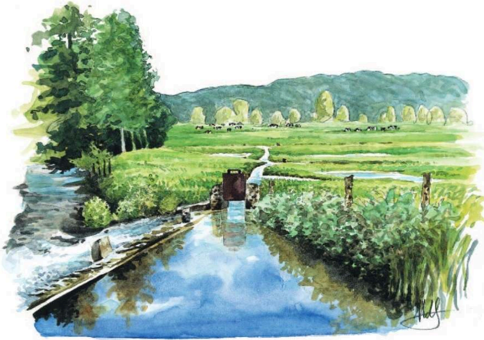
Figure 1. Illustration d'un canal gravitaire.

Au premier plan, un seuil dérive les eaux de la rivière. Au second plan, la vanne est ouverte. Elle permet de réguler les débits d'eau vers les canaux primaires et secondaires qui arrosent les prairies