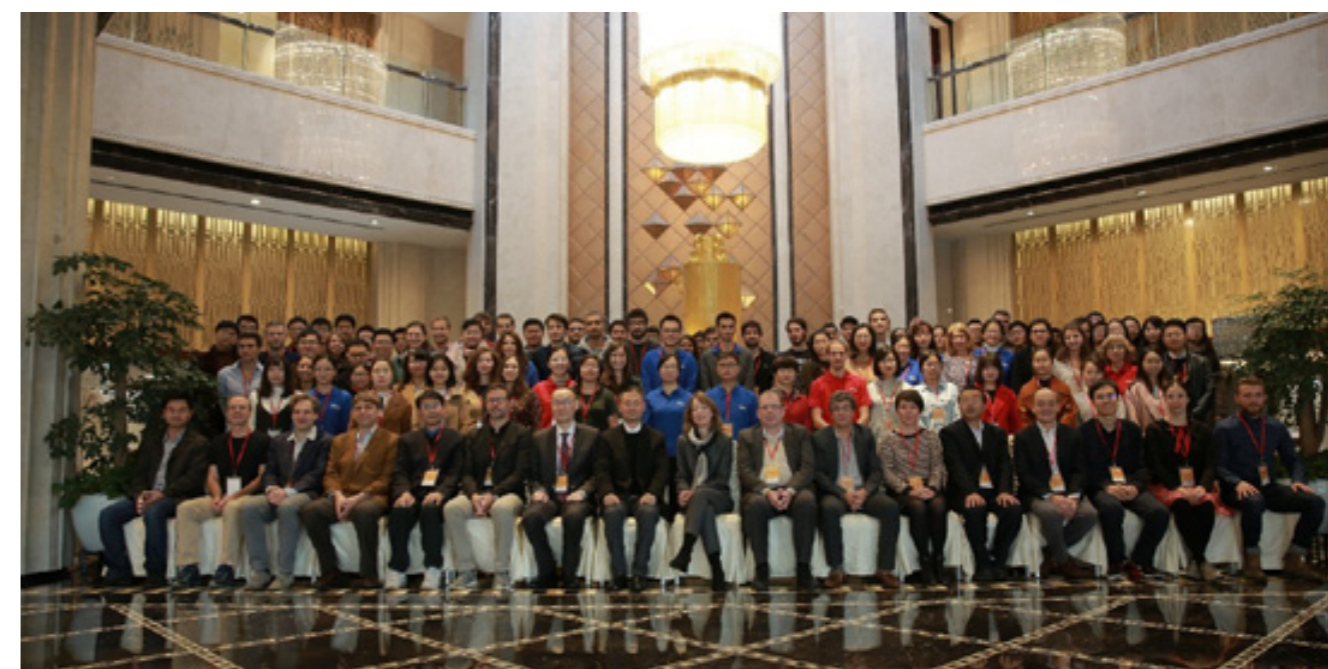
■ Sino-French workshop on Atmospheric Environment