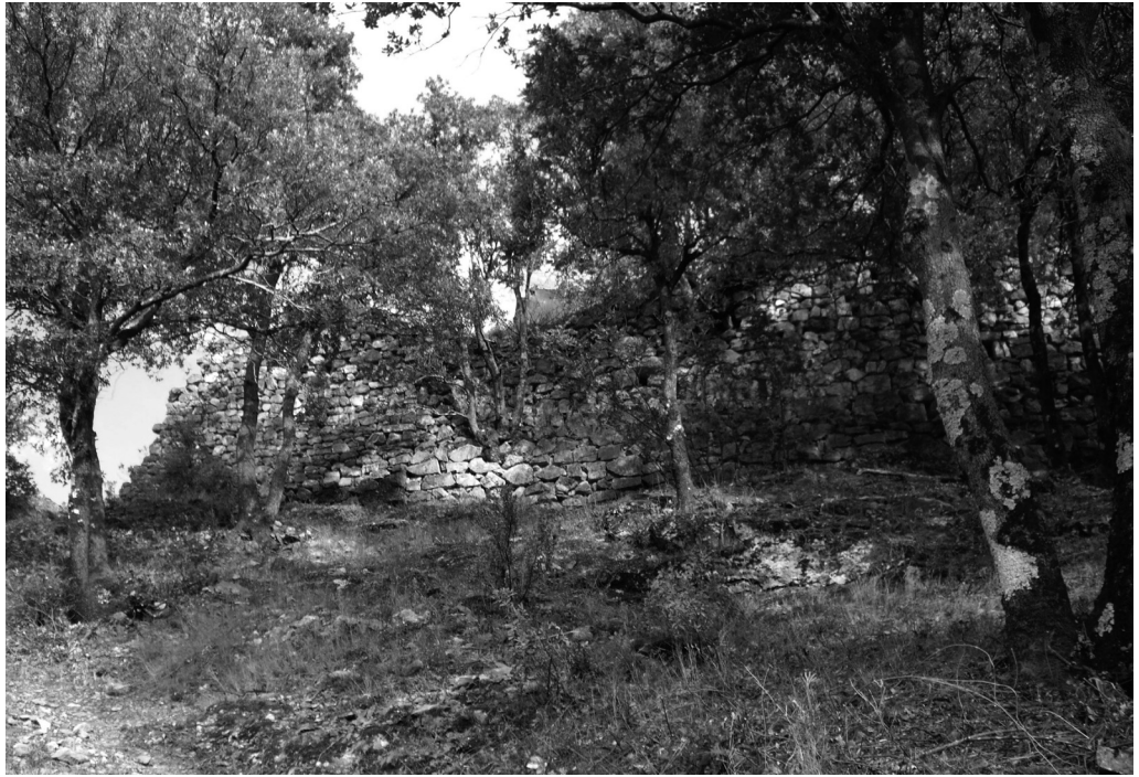
III. 2 : Rempart du château de Reynès.