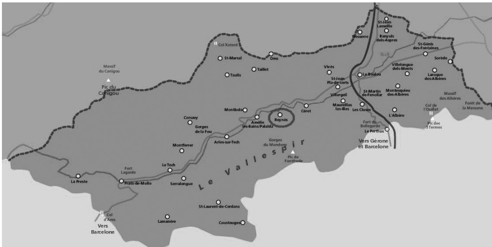
Localisation du village de Reynès

Le mot catalan capbreu vient de la contraction du latin caput breve et peut prendre à l'origine le sens d'une description résumée ou bien d'un inventaire, d'une liste 1 , par la suite il désigne plus souvent un recueil de reconnaissances. Le capbreu à partir du XIII e siècle est donc un document confectionné sous l'égide d'un notaire, document qui vise à recenser les biens et droits du seigneur commanditaire, laïc ou ecclésiastique. La rédaction définitive du capbreu est l'ultime étape d'un processus généralement appelé capbrevació au cours duquel le notaire consigne les reconnaissances individuelles des tenanciers en présence de témoins représentant la communauté 2 . Cette communication s'appuie sur l'étude de deux capbreus conservés aux Archives départementales des Pyrénées-Orientales (ADPO) et qui concernent la seigneurie de Reynès, dans le Vallespir, en 1407.