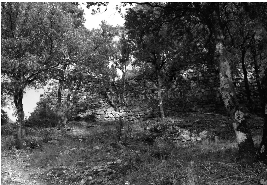
III. 2 : Rempart du château de Reynès.