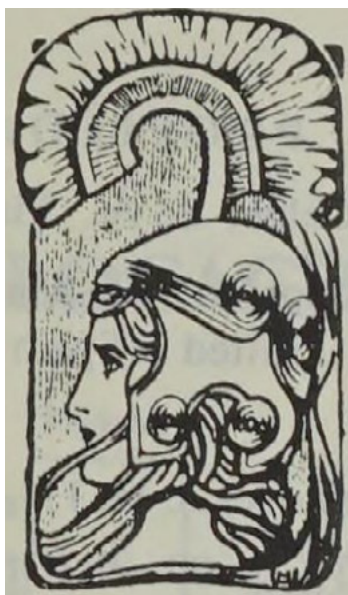
Fig. 1 – Logotype conçu par Miquel Utrillo pour l' Enciclopedia universal ilustrada europeo-americana Espasa-Calpe . Portrait de la déesse Athéna de profil 6 .

est « la Minerve d'aujourd'hui » 3 ; cette même Minerve / Athéna dont Utrillo dessinera un portrait pour réaliser le célèbre logotype de l' Enciclopedia universal ilustrada europeo-americana Espasa-Calpe [Fig. 1] 4 , ouvrage publié entre 1907 et 1933 et dont il dirigera la partie artistique entre 1905 et 1919. Minerve permet également de faire le lien entre Utrillo et la science astronomique. En effet, selon l'homme politique et intellectuel français François Noël (1756-1841), dans l'Antiquité, la déesse Minerve était profondément liée à l'astronomie. Voici ce que nous pouvons lire dans le deuxième tome de son Dictionnaire de la fable dont la quatrième édition, que nous avons pu consulter, est parue en 1823 : « On attribuait à cette déesse [Minerve] l'invention de l'astronomie » 5 . Par ailleurs, dans les périodiques illustrés Luz et Pèl & Ploma , nous avons pu constater que l'un des pseudonymes de Utrillo est « A. L. de Barán », jeu de mot autour du nom Aldébaran qui est l'étoile principale de la constellation du Taureau.