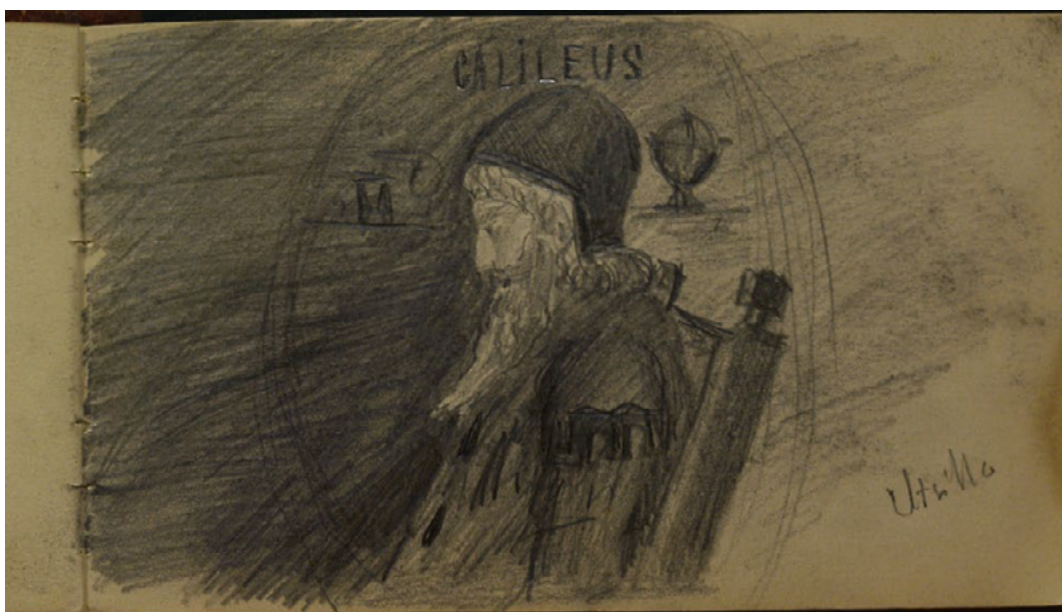
Fig. 4 – Dessin au crayon de Miquel Utrillo. Bibliothèque Santiago Rusiñol. Fonds Miquel Utrillo.

L’autre dessin est un portrait en buste et de profil du célèbre savant et astronome italien Galilée (1564-1642), derrière lequel est esquissé un globe tandis qu’au-dessus de sa tête est écrit au crayon « Galileus » [Fig. 4]. Peut-être l’image a-t-elle été copiée d’un médaillon que nous n’avons pu retrouver à ce jour. En tous les cas, nous constatons que durant son adolescence, le domaine astronomique était connu d’Utrillo.