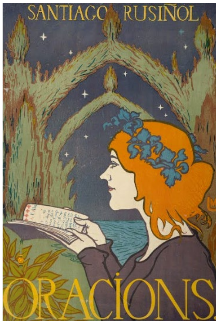
Fig. 6 – Miquel UTRILLO, Oracions , 1897, chromolithographie sur papier, 63 x 44,2 cm 33 .

Bien que nous ne puissions l'affirmer, nous pensons que les étoiles représentées dans cette affiche, si nous l'inversons à 180°, forment la constellation d'Hercule, selon un planisphère réalisé en 1884 sous la direction de Camille Flammarion [Fig. 7]. En somme, Utrillo cherche à représenter la nature de manière plus ou moins scientifique tout en faisant ressortir un ensemble cosmique harmonieux et transcendant ainsi que Rusiñol tend à l'exprimer dans ses différentes oraisons : « [...] l'home resa davant de lo que contempla amb els ulls idealisats, i pressenteix, tot resant, que l'oració és corresposta, que s'enllaça am les coses que 'l rodejen, i que tot resa a sa manera, formant un concert harmonic d'essencia misteriosa » 34 .