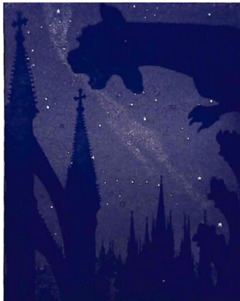
Fig. 8 – Miquel UTRILLO, « A les Catedrals Gòtiques », illustration publiée dans Santiago RUSIÑOL, Oracions . Barcelone : L'Avenç, 1897, p. 193 36 .

Par ailleurs, sur le planisphère est dessinée la voie lactée, ce qui démontre que celle-ci est clairement connue et diffusée en cette fin de XIX e siècle, notamment grâce aux dessins de Etienne Léopold Trouvelot (1827-1895), illustrateur scientifique et astronome français. Celui-ci publie à New York, en 1882, l'album Astronomical drawings composé de plusieurs de ses pastels donnant à voir divers objets cosmiques, dont la Voie lactée 35 . C'est très certainement à partir de ce type de document que Miquel Utrillo a dessiné l'une des illustrations d' Oracions intitulée « A les catedrals Gotiques » [Fig. 8].