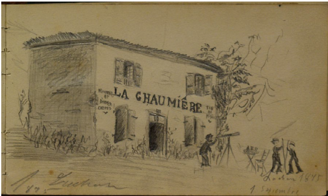
Fig. 3 – Dessin au crayon de Miquel Utrillo, réalisé à Luchon le 1 er septembre 1875. Bibliothèque Santiago Rusiñol. Fonds Miquel Utrillo.

Bien que nous sortions du cadre chronologique de cet article, nous avons observé dans l'un des albums d'Utrillo, conservé à la Biblioteca Popular Santiago Rusiñol de Sitges et daté d'entre 1875 et 1876, différents croquis que celui-ci, alors tout jeune