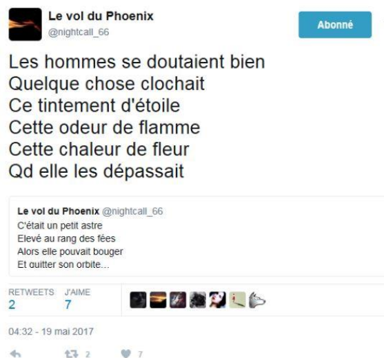
Illus. 4 : Exemple de double tweet

La limitation à 140 caractères n'est pas une limite infranchissable pour les poètes. Afin de bénéficier de plus de longueur, ils ont la possibilité d'écrire deux tweets en réponse l'un à l'autre :