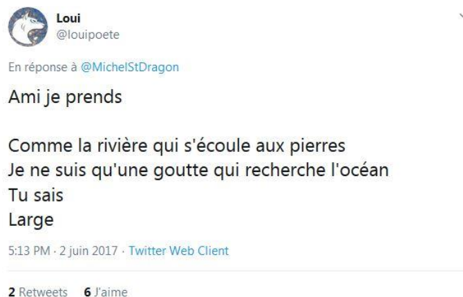
Illus. 12 : Emprunt et répétition de mots