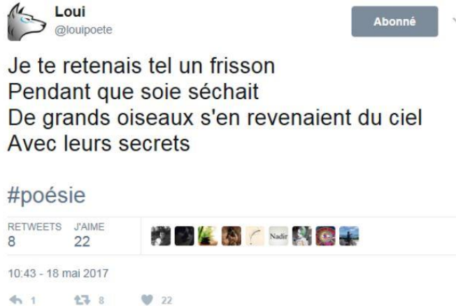
Illus. 1 : Exemple de poème court

Écrit par @Louipoète le 18 mai 2017 à 10h43, ce tweet est court. Il comptabilise 112 caractères. Il n'a pas de titre, les seules mentions apparaissant au début du texte sont les indications propres à son compte (image d'un loup et noms du compte). La mise en forme privilégie des retours à la ligne. Ce n'est pas le dispositif qui impose ces coupures particulières mais le poète lui-même qui a choisi de découper ses phrases de la sorte. Il a par ailleurs intégré des majuscules à chaque début de ligne. Par sa concision, ces retours à la ligne, par ces indications typographiques, @Louipoète écrit un texte qui prend la forme d'une strophe composée de vers. Le tweet devient alors poème. Il en prend les codes, ou du moins un certain nombre (organisation en vers, en strophe, majuscules). Dit autrement, @Louipoète a mobilisé des éléments qu'il jugeait pertinents et adaptés à son projet : écrire un poème. Il nomme ce qu'il fait en intégrant la mention « #poésie ». Ces manières de faire, cette utilisation des caractéristiques propres à la poésie écrite sont reprises par de nombreux autres poètes.