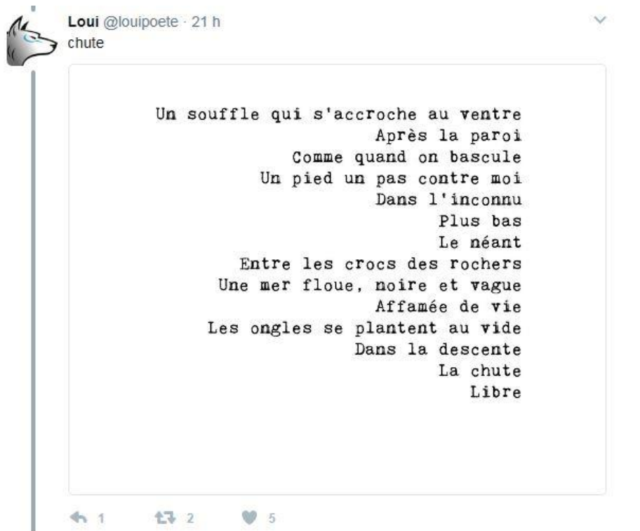
Illus. 7 : Deuxième exemple de tweet d'image de texte

@amphetaligne publie ici une image d'un texte comportant 523 caractères. Quelques indices nous indiquent qu'il s'agit d'une capture d'écran réalisée à partir d'un logiciel de traitement de texte : le soulignement du mot « aucun » provoqué par le correcteur orthographique ; mais également la présence de la barre du pointeur de texte à la fin du nom de la poète « Astrée ». Cette manière de procéder lui permet de dépasser les propres limites de l'éditeur de texte de Twitter : un texte plus long et la possibilité de le centrer (impossible dans un tweet classique). @amphetaligne, n'étant pas soumise à une écriture économe, s'autorise même à signer son poème. Cette technique du tweet d'image de texte est utilisée par de nombreux autres poètes. Dans le poème de @Louipoete ci-dessous, il ne s'agit pas tant de dépasser les capacités de volume de texte que d'ouvrir à de nouvelles possibilités typographiques et de mise en page :