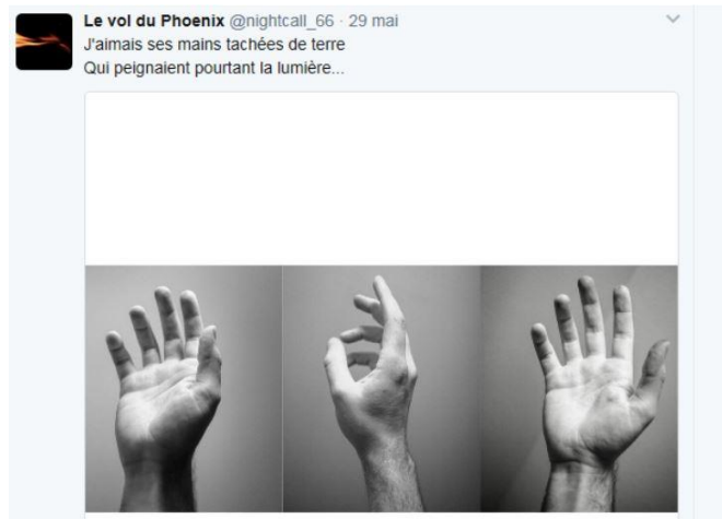
Illus. 5 : Exemple de poème illustré

Ce court poème (72 caractères) de @nightcall_66 est suivi par une photographie. Le texte « ses mains tachées (...) » est illustré par les trois images situées juste en dessous. Ce tweet est également un exemple intéressant des différentes formes d'écriture que les poètes peuvent adopter successivement. Dans l'illustration précédente, la poète n'intègre pas de rime ni de métrique particulière pour ses vers. Le texte est rythmé graphiquement par des retours à la ligne qui découpent les phrases. Dans le poème ci-dessus, les deux vers sont à contrario rimés « (...) terre / (...) lumière » et respectent la métrique des octosyllabes (8 pieds par vers). Au-delà de cette référence aux techniques de versification, ces deux exemples illustrent la capacité qu'ont les poètes à utiliser différentes techniques, au gré de leurs envies d'écriture. L'utilisation de photographies permet également aux poètes d'augmenter la longueur des poèmes :