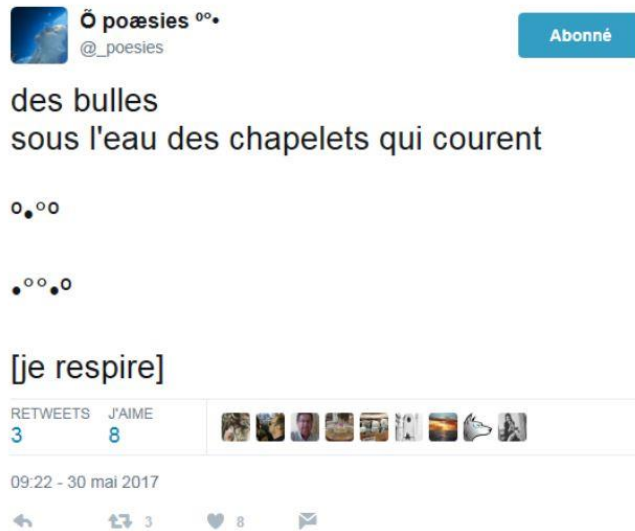
Illus. 3 : Exemple d'utilisation de signes typographiques

La limitation à 140 caractères n'est pas une limite infranchissable pour les poètes. Afin de bénéficier de plus de longueur, ils ont la possibilité d'écrire deux tweets en réponse l'un à l'autre :