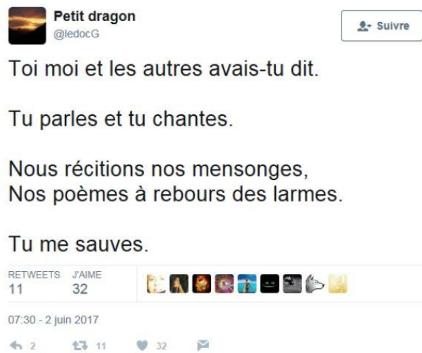
Illus. 2 : Exemple de spatialisation de poème

Écrit par @Louipoète le 18 mai 2017 à 10h43, ce tweet est court. Il comptabilise 112 caractères. Il n'a pas de titre, les seules mentions apparaissant au début du texte sont les indications propres à son compte (image d'un loup et noms du compte). La mise en forme privilégie des retours à la ligne. Ce n'est pas le dispositif qui impose ces coupures particulières mais le poète lui-même qui a choisi de découper ses phrases de la sorte. Il a par ailleurs intégré des majuscules à chaque début de ligne. Par sa concision, ces retours à la ligne, par ces indications typographiques, @Louipoète écrit un texte qui prend la forme d'une strophe composée de vers. Le tweet devient alors poème. Il en prend les codes, ou du moins un certain nombre (organisation en vers, en strophe, majuscules). Dit autrement, @Louipoète a mobilisé des éléments qu'il jugeait pertinents et adaptés à son projet : écrire un poème. Il nomme ce qu'il fait en intégrant la mention « #poésie ». Ces manières de faire, cette utilisation des caractéristiques propres à la poésie écrite sont reprises par de nombreux autres poètes.