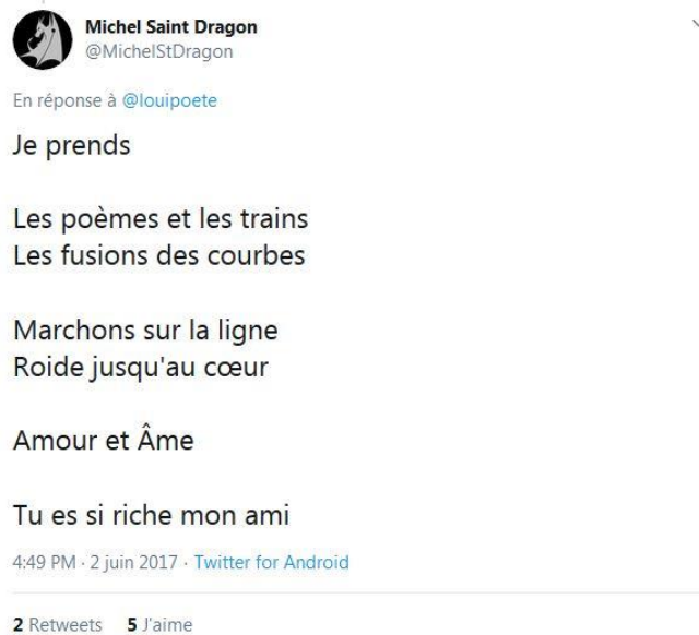
Illus. 11 : Tweet de continuation

Onze minutes plus tard, @Louipoete publie à son tour un poème. La plateforme indique sur son tweet « En réponse à @MichelStDragon ». Constitué de cinq lignes de texte, des majuscules et un jeu autour des pronoms personnels (« Il, (e)Il(e), Moi toi nous, toi...), son tweet provoque moins de réactions (un retweet et quatre mentions J'aime) mais @MichelStDragon a lu ce poème et a cliqué sur la commande J'aime. L'échange est enclenché.