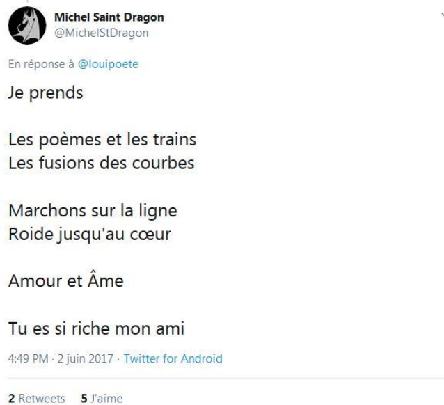
Illus. 11 : Tweet de continuation