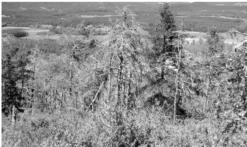
Photo 1 : Dépérissements du pin sylvestre dans le Haut Var (montagne du Lachens)

Concernant les changements de distribution de plantes, Peñuelas et Boada (2003) ont observé sur le Montseny au nord-est de l'Espagne sur la période 1950 – 2000, une remontée du hêtre d'environ 70 m avec un remplacement par le chêne vert à moyenne altitude (800 m – 1400 m). Ces changements de distribution de plantes en altitude vers des formations plus xériques préfigurent les changements attendus en latitude.