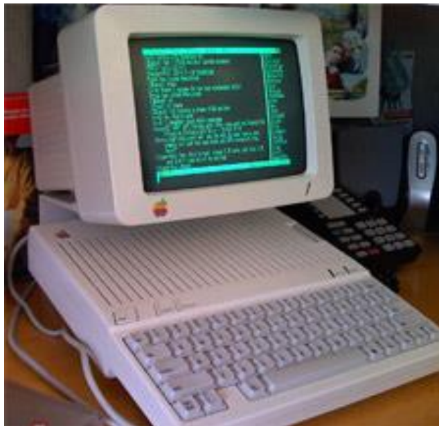
Figure 1. Mon Apple II C

Et les anciens, comme moi, se souviennent de l'effort que demande la consultation de gros dictionnaires. Je les plaçais de part et d'autre de mon clavier (deux Harrap's), pour avoir à faire le minimum de mouvements pour les consulter.