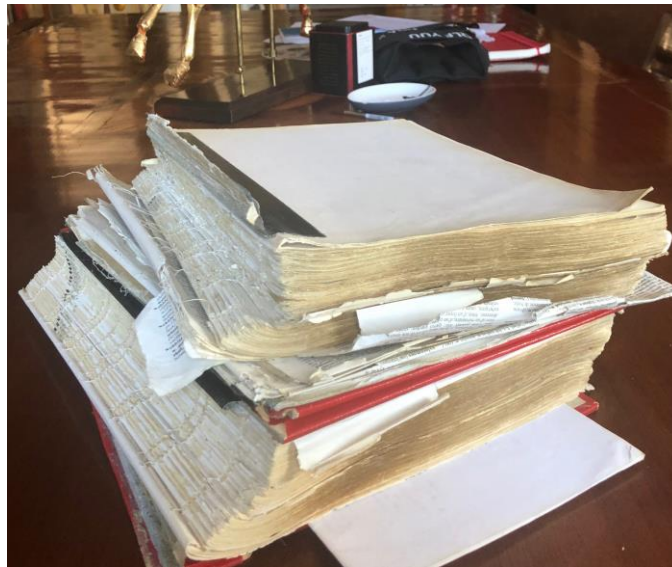
Figure 2. État actuel de mes dictionnaires.