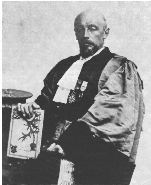
René Blondlot ca. 1910

Les possibilités semblent illimitées. Pendant plusieurs années, Blondlot en étudiera systématiquement les propriétés (réflexion, réfraction, dispersion, etc.). L'Académie des sciences lui décernera sa médaille d'or, ainsi que le prestigieux prix Lalande.