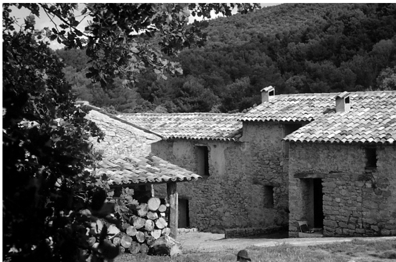
Photo 5 (ci-dessus) : Un groupe de peintres amateurs suédois logent régulièrement dans ce hameau situé au cœur d'une forêt près de Draguignan (Var).

région Nord-Picardie vont suivre la même démarche avec l'aide du CRPF local. Cette formule pourrait être mise en place dans un département touristique comme le Var où il existe des unités foncières conséquentes.