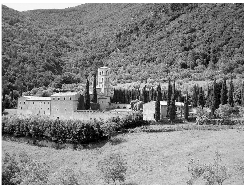
Photo 4 : La magnifique abbaye de San Pietro in Valle