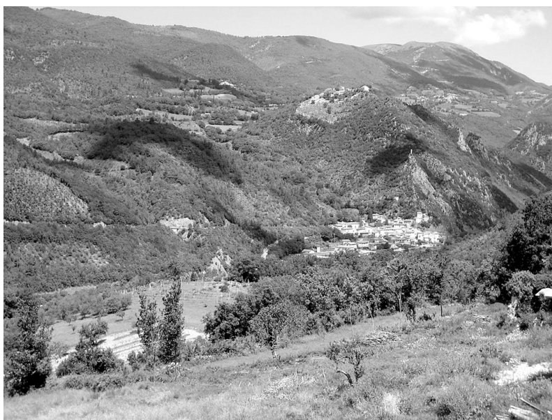
Photo 3 : Vue depuis le village de Valle di Nera (ou Valdinero) des collines abritant les peuplements de pin d'Alep Photo DA

Photo 2 : Peuplement de chêne chevelu éclairci Photo DA