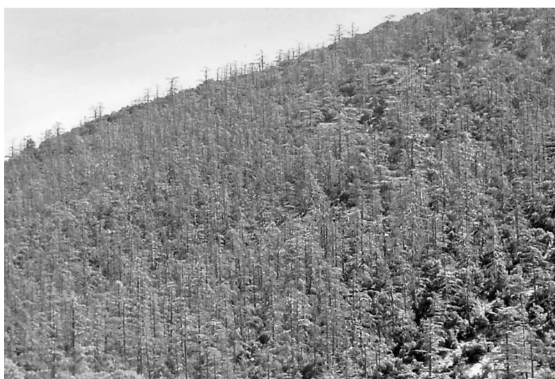
Photo 1 : Dépérissement massif du Cèdre de l'Atlas au Bélezma

A Ouled Yakoub, le dépérissement est moins spectaculaire, mais commence à devenir inquiétant. De quelques arbres isolés présentant un dessèchement de la cime, l'attaque est devenue plus importante, et ce sont des bouquets entiers de Cèdres qui commencent à dépérir (Cf. Photo 2).