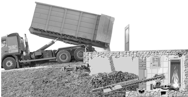
Photo 3 : Coupe de la chaudière à plaquette installée à la Maison de pays à Beauzezer en décembre 2004 : le voyage de la plaquette du camion au foyer de combustion