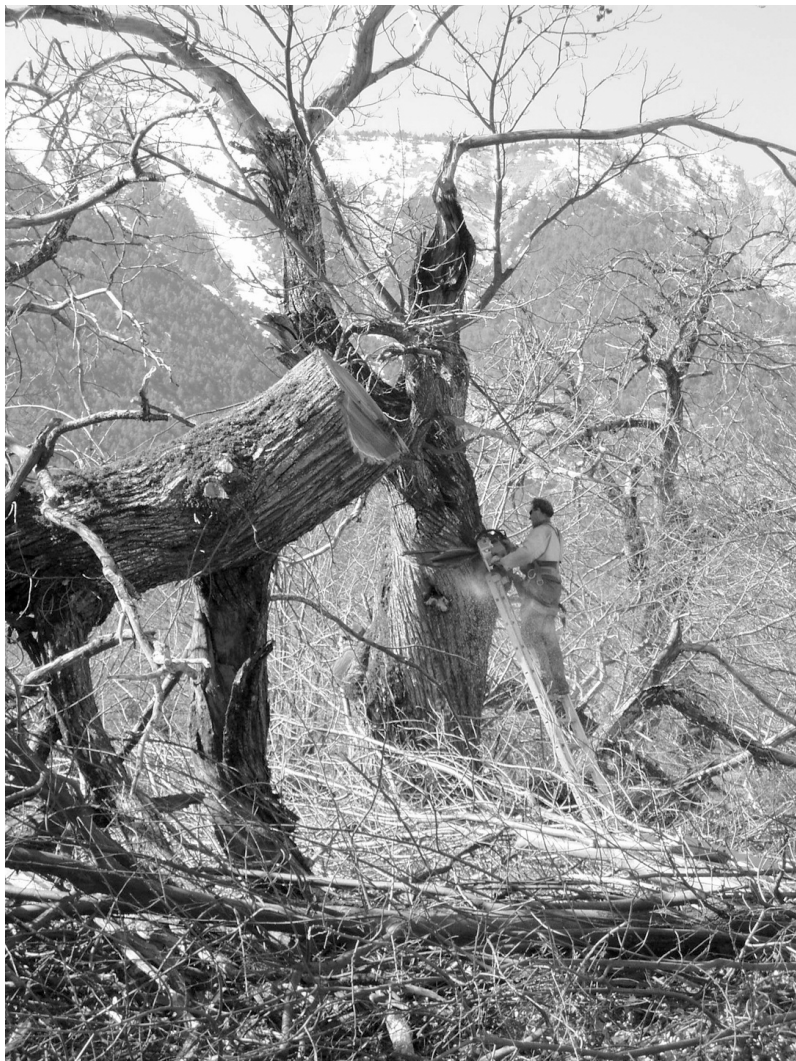
Photo 4 : Rénovation de la châtaigneraie d'Annot : élagages sévères et abattages-greffages en mars 2005

lignes de financement peu lisibles et très rarement transversales, alors même qu'elle a pour objectif la multifonctionnalité. Dans un territoire où la ressource forestière est très peu valorisable économiquement, les projets se portent naturellement vers des fonctions autres de la forêt : risque incendies, champignons, châtaignes, sylvopastoralisme, accueil du public. Ces projets d'aménagement ont pourtant de grande difficulté à entrer dans les lignes de financement actuelles. Il en résulte une perte de crédibilité auprès des élus locaux qui voient les projets échouer, malgré la quantité de temps et d'énergie investie.