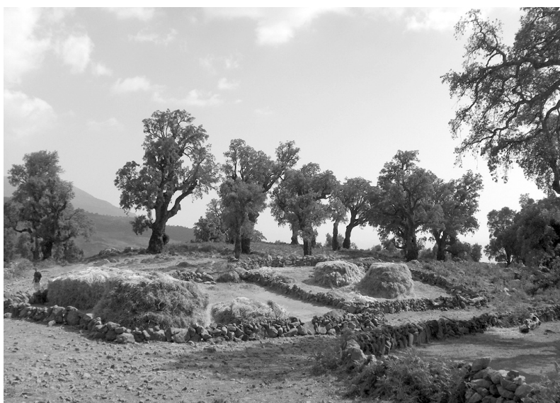
Photos 5 et 6 : Dans le Douar Ain Lahcen, dans une zone reculée de la région, le Parc a aidé à l'aménagement d'une source d'eau à travers la réalisation d'un lavoir et d'un abreuvoir.