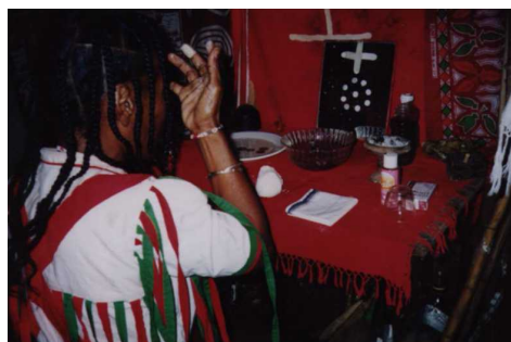
Figure 6 : Séance de possession tromba à Madagascar (cliché Marc Chemillier, 6 août 2000).

Cette approche par la simulation peut être appliquée dans bien d'autres domaines. Je l'ai expérimentée également à propos de la musique à Madagascar en étudiant le répertoire de la cithare marovany jouée dans le culte de possession tromba . La photo de la figure 6 montre une séance de tromba . L'officiante revêt un habit particulier et dispose sur un petit autel différents objets rituels. La séance dure plusieurs heures avec un accompagnement ininterrompu de cithare et de hochets et au bout d'un certain temps, l'officiante tombe en transe en basculant son corps en arrière dans les bras d'une assistante. Durant les phases préparatoires, on peut observer que l'interaction avec le cithariste est très forte. L'officiante lui adresse des invectives et fait des gestes pour orienter son jeu.