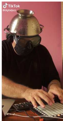
Figure 9 : Vidéo d'une improvisation avec ordinateur sur le compte TikTok de Djazz ( https://www.tiktok.com/@digitaljazz ).