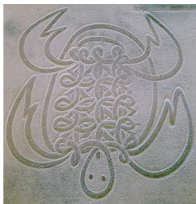
Figure 1 : Dessin vanuatu de la tortue de mer réalisé par Edgar Hinge.

Les organigrammes sont utilisés en informatique dans ce qu'on appelle les « organigrammes de programmation ». Ce sont des représentations graphiques normalisées de l'enchaînement des opérations et des décisions effectuées par un programme d'ordinateur. Même si on ne les visualise pas explicitement, ils sont à la base de toute utilisation de l'informatique. Nous allons présenter des applications logicielles (et donc, implicitement, des organigrammes de programmation) dans le champ de l'anthropologie et des arts. Dans ces domaines il s'agit de mettre en œuvre le concept de simulation. Nous entendons par ce terme le fait de modéliser un savoir relevant de l'oralité, puis de concevoir grâce au modèle un programme d'ordinateur qui imite ce savoir et peut, en théorie, produire les mêmes objets culturels. L'intérêt de cette démarche d'un point de vue anthropologique est de permettre ensuite la confrontation de ce « robot » avec les détenteurs du savoir étudié et de vérifier si les productions de la machine sont acceptables ou non aux yeux des connaisseurs. Au-delà de cette utilisation anthropologique de l'intelligence artificielle, les programmes simulateurs peuvent aussi avoir des applications intéressantes dans le champ artistique et nous en montrerons quelques exemples. On verra que la mise en œuvre d'artefacts de ce type conduit à réfléchir à la notion de présence dans les arts et la culture.